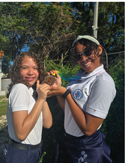
Estudiantes que compitieron en fútbol.

Estos logros son el resultado del esfuerzo conjunto de las estudiantes JETC, sus familias y el equipo académico, quienes día a día fomentan valores de trabajo en equipo, perseverancia y superación personal.