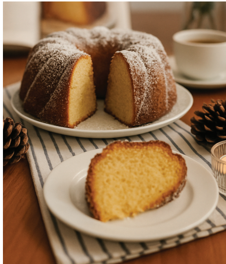
Bizcocho perfecto para acompañar una taza de café.

El ron y el azúcar son parte del alma de República Dominicana, dos ingredientes que cuentan su historia y tradición. Este panqué con ron combina la dulzura del azúcar nacional "Caña Linda" con la calidez y el carácter del ron dominicano, logrando un postre esponjoso y aromático. Una receta sencilla pero llena de identidad caribeña,