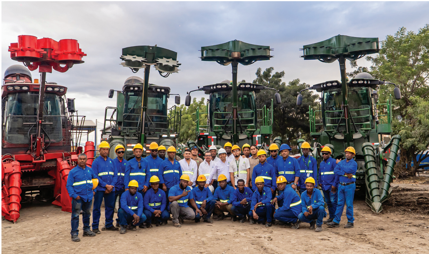
La familia azucarera se prepara para una nueva zafra, con la convicción de que el esfuerzo en equipo es el motor de cada logro.

Más de 3,000 colaboradores inician una temporada clave para el desarrollo productivo y social del Sur, en el marco del 26 aniversario del CAC. P3