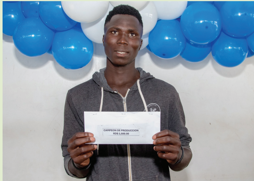
Picador reconocido durante el periodo de corte 2024-2025.