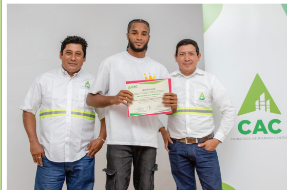
Participante recibe su certificado tras completar satisfactoriamente el programa de formación.

La iniciativa está dirigida tanto a colaboradores internos como a miembros de las comunidades vecinas, quienes reciben capacitación en la conducción de vehículos