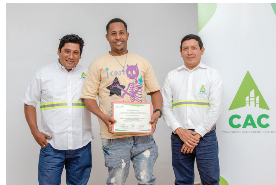
Escuela de Choferes CAC: misión cumplida.

Como parte del cierre de la Escuela en su versión 2025, cerca de 40 participantes recibieron sus certificados en un acto realizado en el Salón Multiusos, marcando la culminación de un proceso formativo riguroso y enriquecedor. La entrega simboliza no solo la adquisición de nuevas competencias técnicas, sino también el fortalecimiento del compromiso con la seguridad, la responsabilidad y la excelencia operativa que distinguen al CAC.