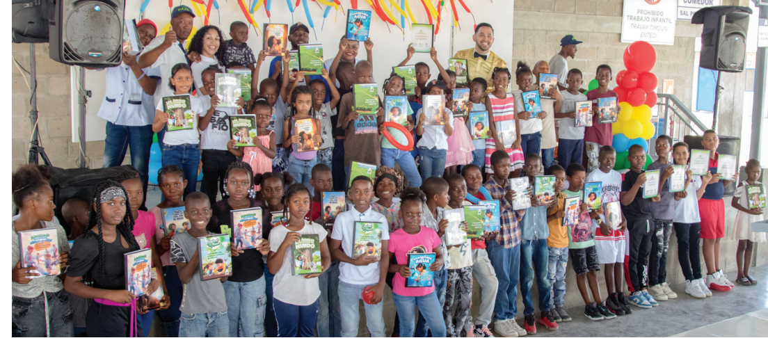
Niños del Área Agrícola reciben sus cuadernos escolares durante la entrega realizada en el Complejo Habitacional del CAC.