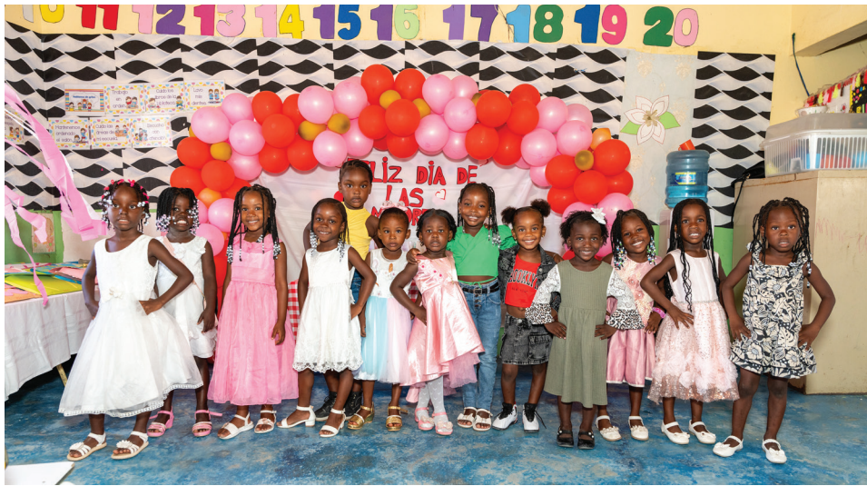
Estudiantes del Programa de Educación Inicial posan felices tras culminar el año escolar, celebrando sus logros y crecimiento.

Con este cierre de año escolar, la Fundación Central Barahona reafirma su compromiso con la educación como base del desarrollo de las comunidades del Sur.