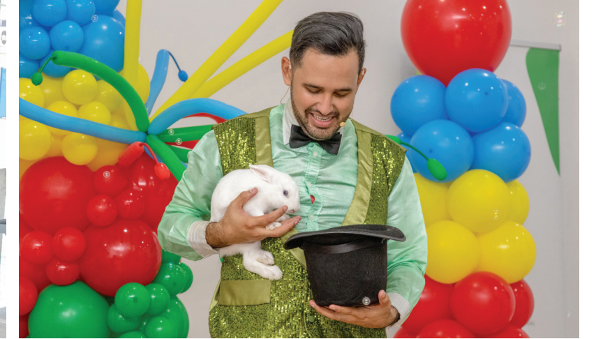
El show de magia acompañó la entrega de cuadernos en el Salón Multiusos del Área Administrativa.

El Consorcio Azucarero Central (CAC) llevó a cabo la tradicional entrega de cuadernos escolares 2025-2026, en cumplimiento de la Cláusula No. 30 del Convenio Colectivo de Condiciones de Trabajo. Esta iniciativa, organizada por el Departamento de Gestión de Talento, reafirma el compromiso de la empresa con la educación de los hijos de sus colaboradores y con el fortalecimiento del bienestar familiar.