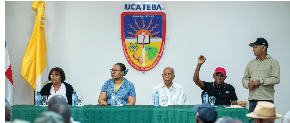
Representantes del CAC y de los parceleros durante el acto formal de entrega de cheques del Proyecto Agrario Aguacático I.