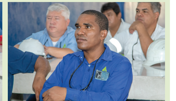
Colaboradores del área Industrial participan atentos en la charla informativa sobre el Convenio Colectivo de Condiciones de Trabajo.

El Consorcio Azucarero Central (CAC), en su interés por concientizar y beneficiar a sus colaboradores, realizó la entrega de los manuales del Convenio Colectivo de Condiciones de Trabajo, con el objetivo de garantizar que todos cuenten con información clara y actualizada sobre sus derechos y beneficios.