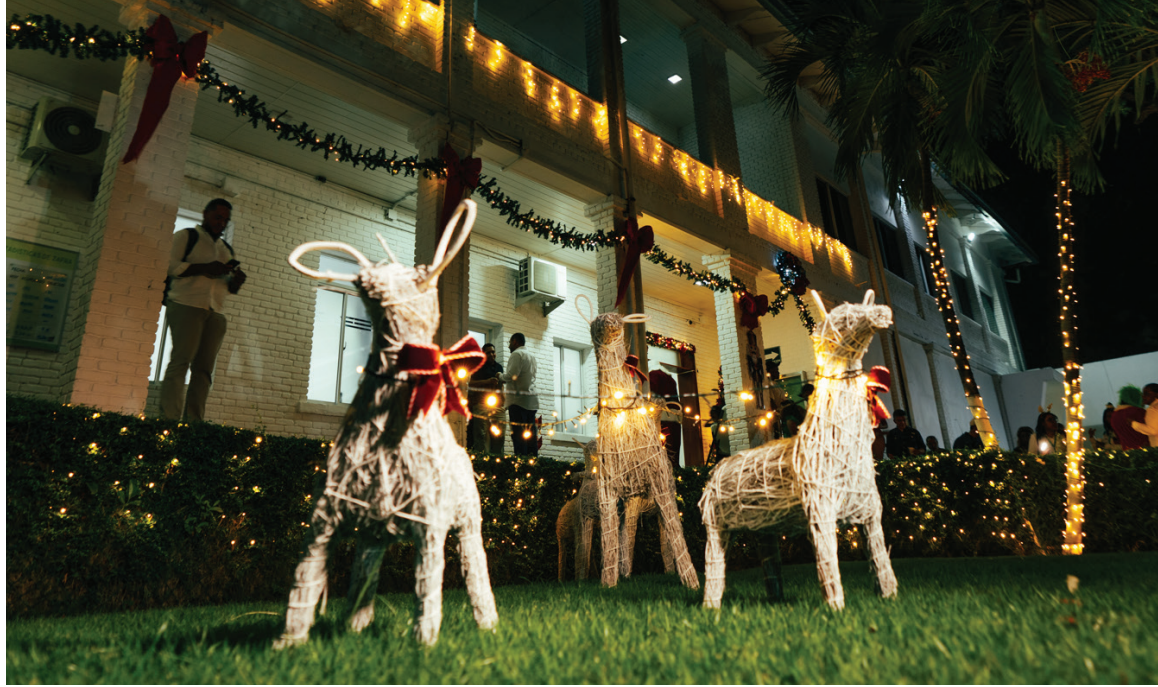
La fachada del edificio Administrativo se iluminó oficialmente con la tradicional decoración navideña, marcando el inicio de la temporada.

La Navidad en el Consorcio Azucarero Central (CAC) es un momento para agradecer, compartir y fortalecer los vínculos que nos unen como familia azucarera. Cada año, la empresa vive esta temporada a través de actividades que reconocen el esfuerzo de sus colaboradores, promueven la integración y mantienen vivas tradiciones que llenan de calidez nuestros espacios de trabajo. Durante el cierre de este año, diversas iniciativas reflejaron el espíritu navideño en las distintas áreas del CAC.