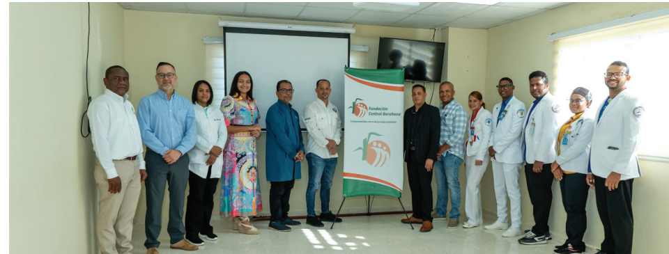
Representantes del CAC, FCB, Grupo Everest y personal médico acompañaron el acto de entrega.

Con esta entrega, el Voluntariado sostiene su compromiso con el fortalecimiento institucional del Hospital Jaime Mota y con el desarrollo del sistema de salud en la región sur del país.