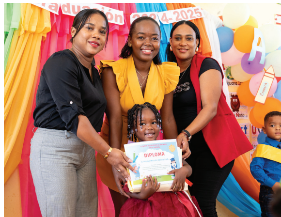
Docentes del Programa de Educación Inicial entregan certificado a estudiante durante el acto de cierre del período escolar 2024-2025.

Con actividades festivas cargadas de alegría y emoción, se realizó el cierre del período escolar en junio 2025 en las nueve escuelas que forman parte del Programa de Educación Inicial de la Fundación Central Barahona, brazo social del Consorcio Azucarero Central.