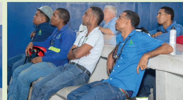
En la charla explicativa se detallaron las actualizaciones del Convenio Colectivo.