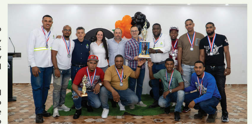
Jugadores Administración reciben medallas y trofeo tras obtener el segundo lugar del Torneo de Baloncesto 2025.