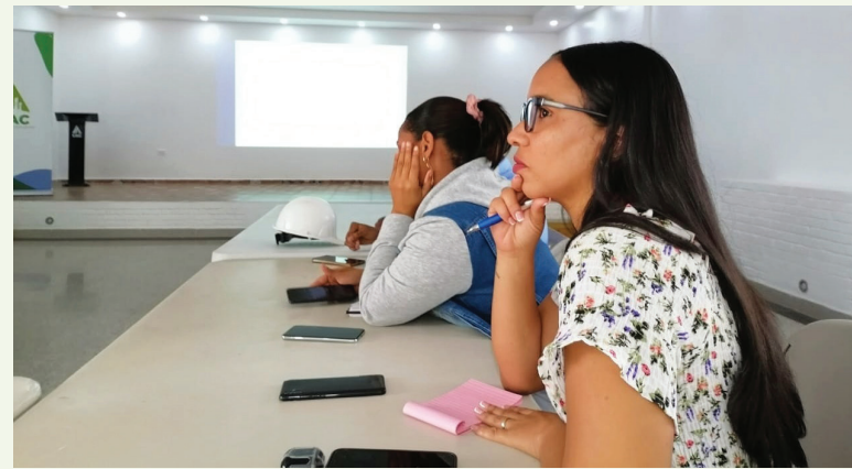
Atención hoy. Desarrollo para toda la vida.

Transforma tu talento, potencia tu futuro