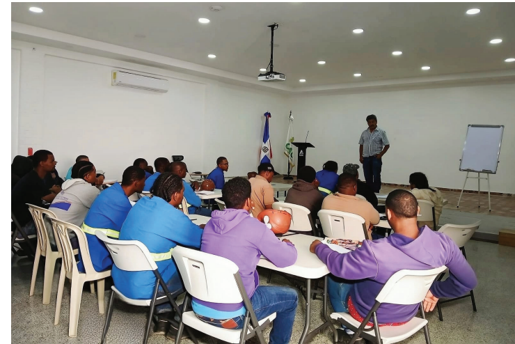
Colaboradores durante capacitaciones de la Escuela de Mantenimiento Técnico.

Con esta iniciativa, el Consorcio Azucarero Central reafirma su compromiso con la profesionalización continua de su capital humano, impulsando el crecimiento del talento interno y fortaleciendo los procesos industriales que sostienen la operación.