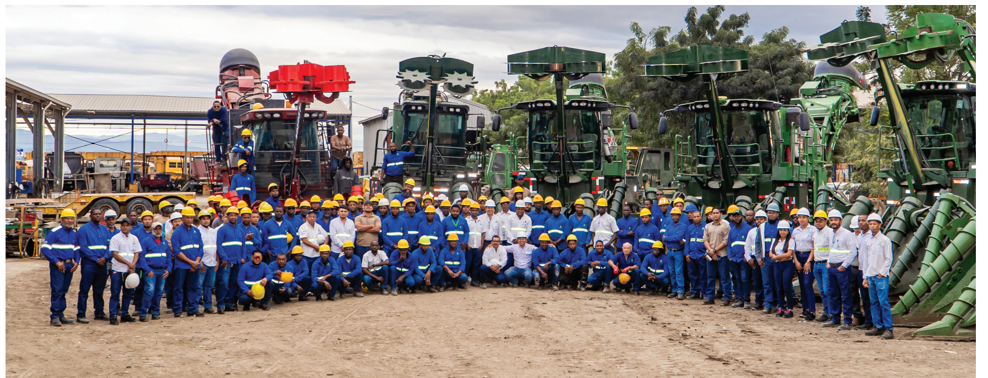
Personal listo para una zafra exitosa.