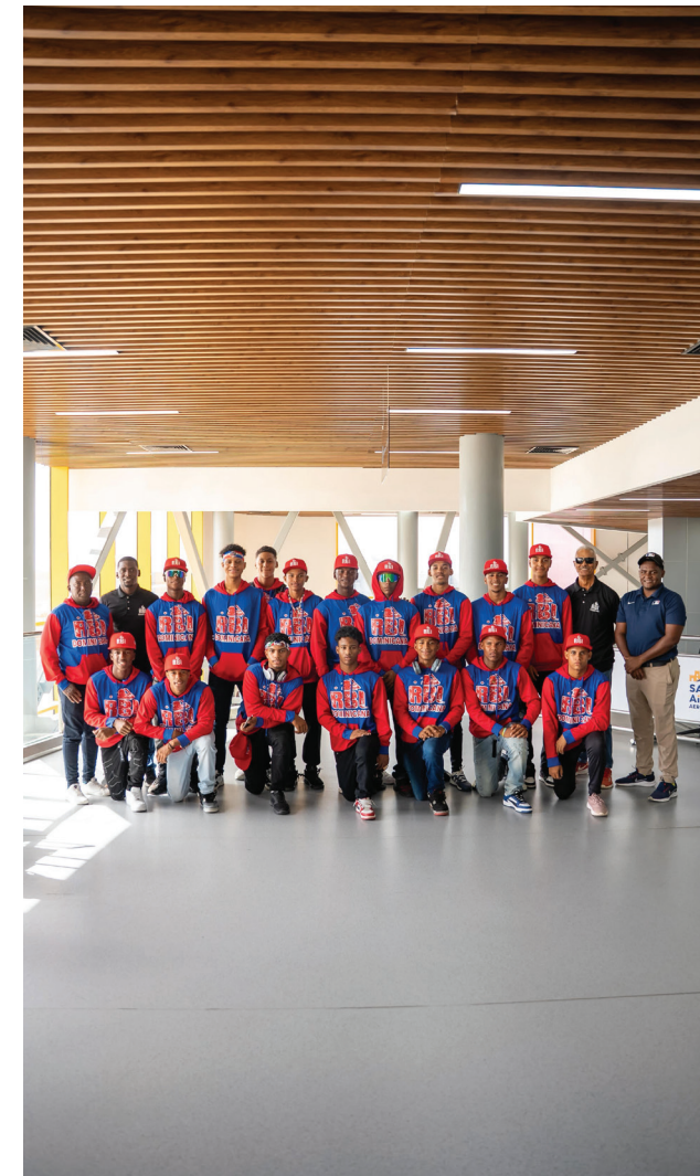
Jugadores de la selección categoría 14-15, quienes se coronaron como campeones en el torneo Regional.

El programa RBI no solo impulsa el desarrollo deportivo, sino que fortalece valores, liderazgo y oportunidades para jóvenes de comunidades vulnerables. A través de la Fundación Central Barahona, el Consorcio Azucarero Central continúa sembrando futuro, creando espacios donde el deporte se convierte en herramienta de transformación social.