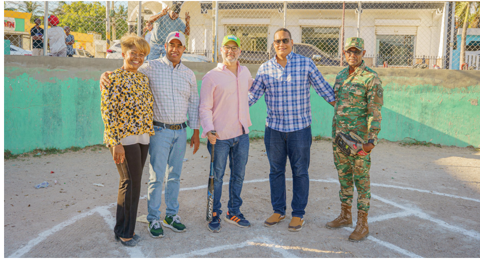
Directivos y autoridades locales participan en el lanzamiento oficial del Torneo de Softball 2026.

Con entusiasmo se celebró el XVI Torneo CAC de Softball 2025 del Consorcio Azucarero Central, una iniciativa que reafirma el compromiso de la empresa con la integración, el bienestar y el fortalecimiento de los lazos entre sus colaboradores a través del deporte.