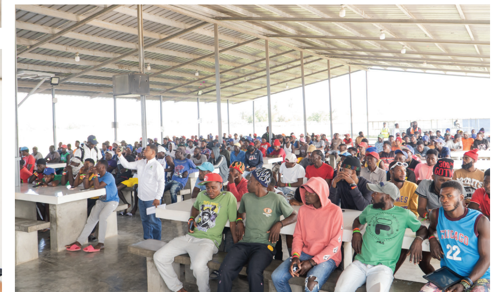
Vista de los colaboradores de Corte Manual en el Complejo Habitacional.

El CAC agradeció la participación del Ministerio de Trabajo, autoridades invitadas y equipos internos, así como la disposición de los más de 230 colaboradores que se integran a la operación, quienes desempeñan un rol fundamental para el desarrollo de la agroindustria azucarera del país