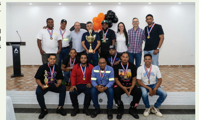
Equipo Industrial recibe el trofeo de campeón junto a directivos, tras una destacada participación en el torneo.