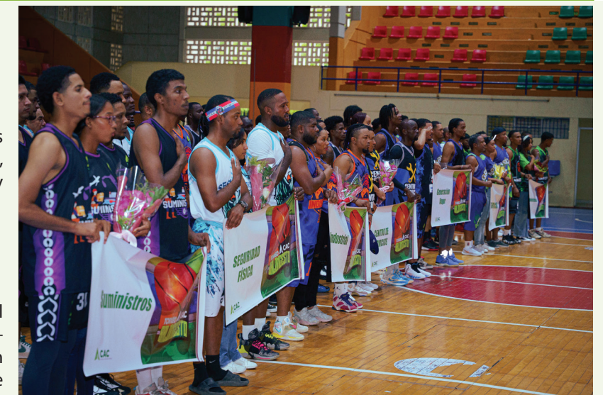
Equipos participantes se alinean durante el acto inaugural del torneo.

Con la realización del III Torneo de Baloncesto, el Consorcio Azucarero Central reafirma su propósito de impulsar el deporte como herramienta de bienestar, integración y desarrollo, fortaleciendo un ambiente laboral positivo y participativo.