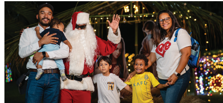
Colaboradores disfrutaron junto a sus hijos de un espacio de integración y tradición durante el encendido de luces.