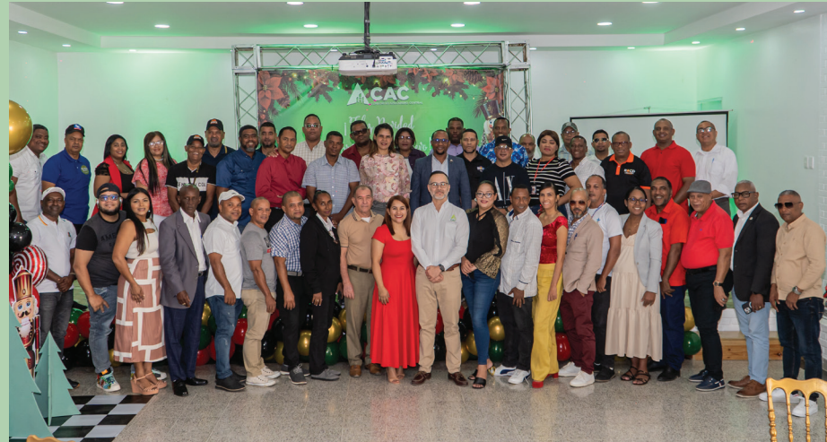
Grupo de periodistas que se dieron cita al encuentro.