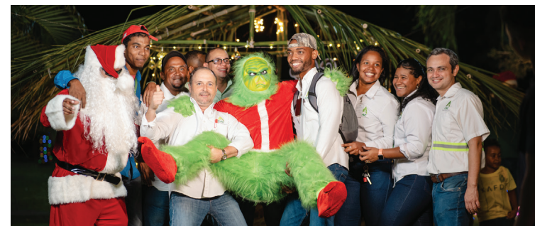
El espíritu navideño reunió a grandes y pequeños en una noche cargada de ilusión y unión institucional.