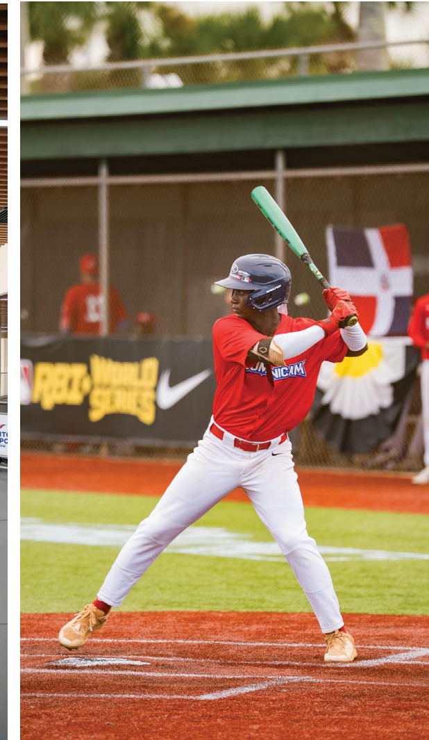
Un destello de talento representó al país en Vero Beach, Florida.