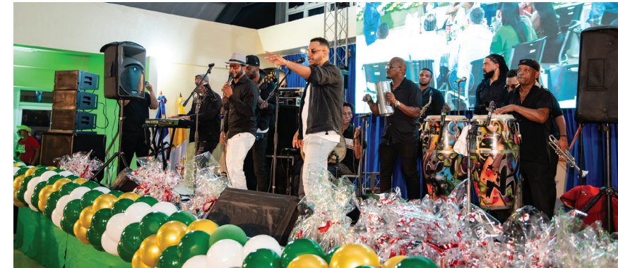
A ritmo de orquesta en un ambiente festivo se disfrutó la tradicional cena de navideña.