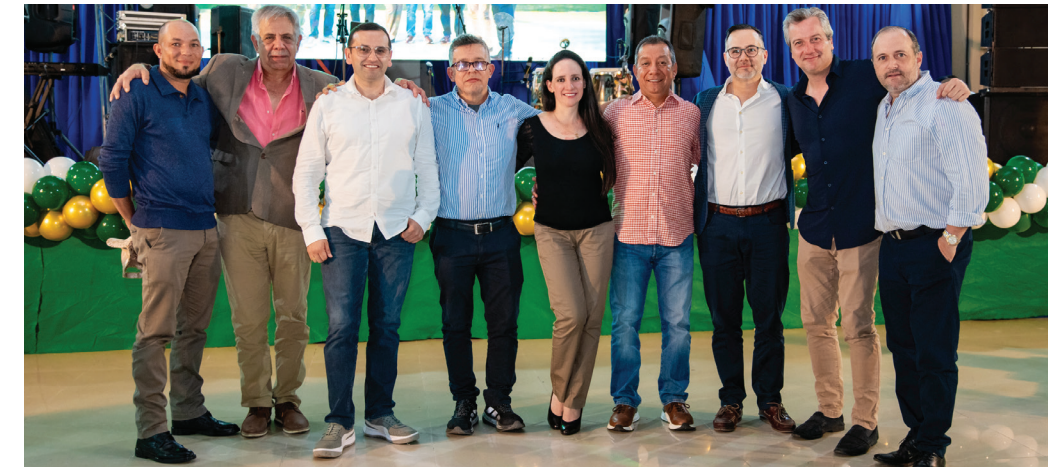
Líderes de las distintas gerencias acompañaron la celebración, reafirmando el compromiso y la cercanía con el equipo.

Asimismo, la empresa CORAGRI se sumó a la celebración, entregando dos placas especiales a sus colaboradores, en reconocimiento a su esfuerzo y contribución al éxito de la organización.