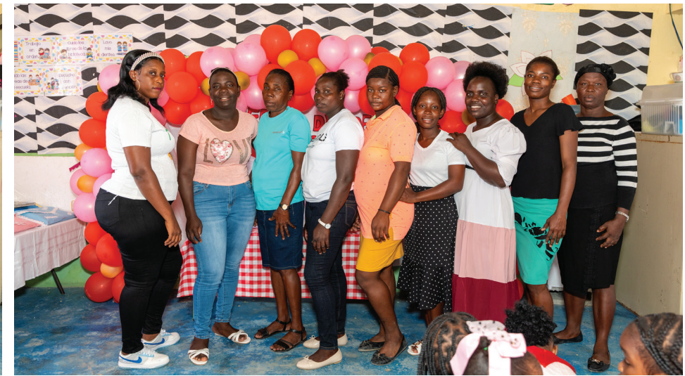
Madres de estudiantes participan en la celebración especial organizada en su honor, en un ambiente de alegría y reconocimiento.