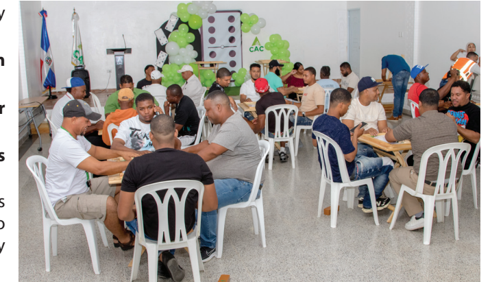
Vista de los jugadores durante las partidas.

Esta actividad forma parte de las iniciativas tradicionales que se realizan al finalizar el período de reparación, marcando el inicio previo de la zafra y fortaleciendo el espíritu de la familia azucarera.