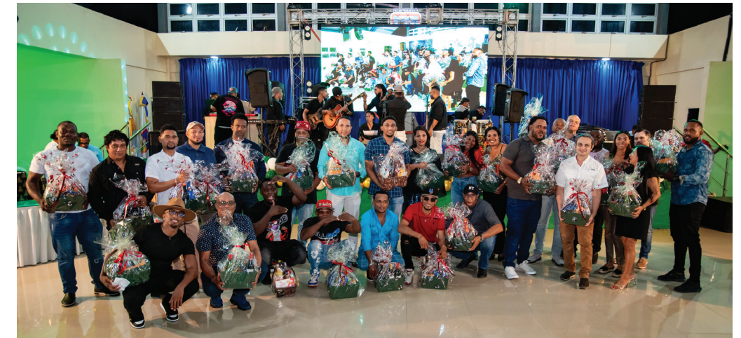
Colaboradores disfrutaron de una velada especial marcada por la gratitud y además recibieron premios.