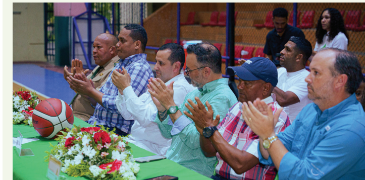
Directivos e invitados especiales acompañaron la ceremonia inaugural, respaldando esta iniciativa de integración y sana competencia.

El Consorcio Azucarero Central (CAC) concluyó con éxito el III Torneo CAC de Baloncesto 2025, una competencia que destacó el talento deportivo, la disciplina y el espíritu competitivo de sus colaboradores, consolidándose como un espacio que fomenta la sana competencia, el compañerismo y la integración entre las distintas áreas de la empresa.