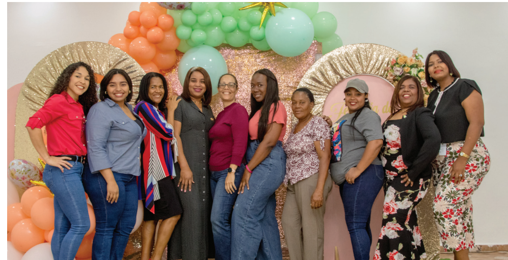
Madres CAC, comprometidas y trabajadoras.

Momentos de alegría y gratitud vivieron las madres del Consorcio Azucarero Central durante su celebración.