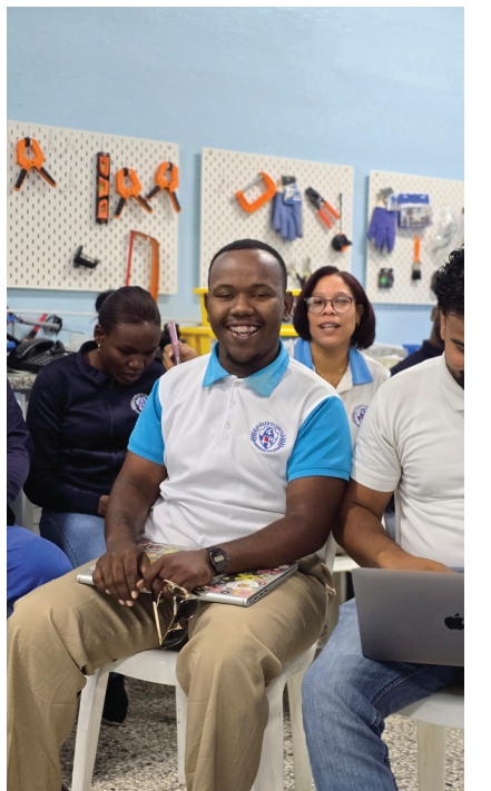
Docente del JETC lidera jornada de inicio escolar con enfoque STEM.

Gracias a este plan, cada maestro del JETC inicia el año escolar con secuencias didácticas sólidas, actividades prácticas y recursos tecnológicos que elevan la calidad del aprendizaje.