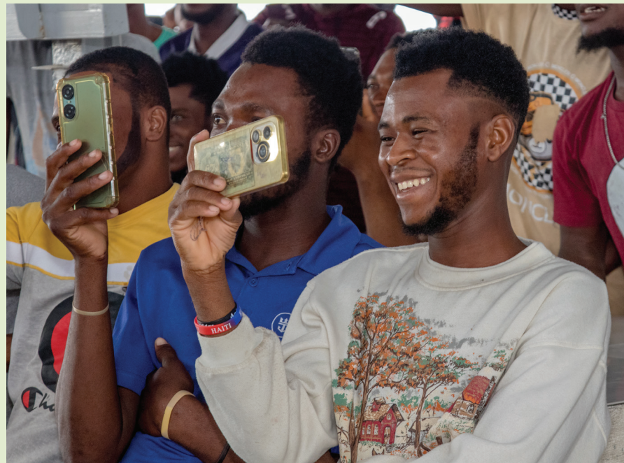
Compañeros celebran y respaldan a los galardonados en la jornada de premiación.