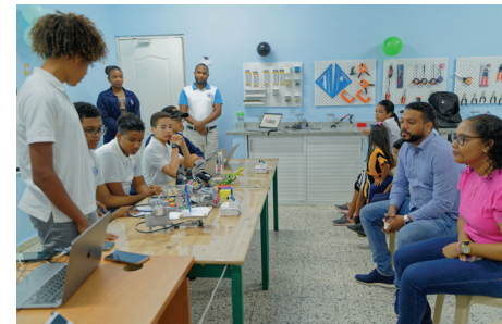
Estudiantes presentan proyectos tecnológicos durante la feria ARTECI 2025, demostrando creatividad, innovación y trabajo en equipo.