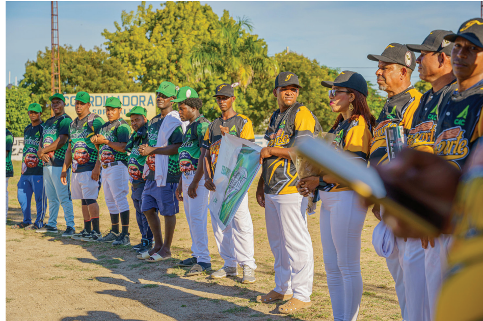
Jugadores se alinean durante la ceremonia inaugural, dando apertura formal a la nueva temporada.

Con la realización de este torneo, el Consorcio Azucarero Central reafirma su propósito de promover la integración, el bienestar y el trabajo en equipo, fortaleciendo espacios que contribuyen a un ambiente laboral positivo y a la sana convivencia entre sus colaboradores.