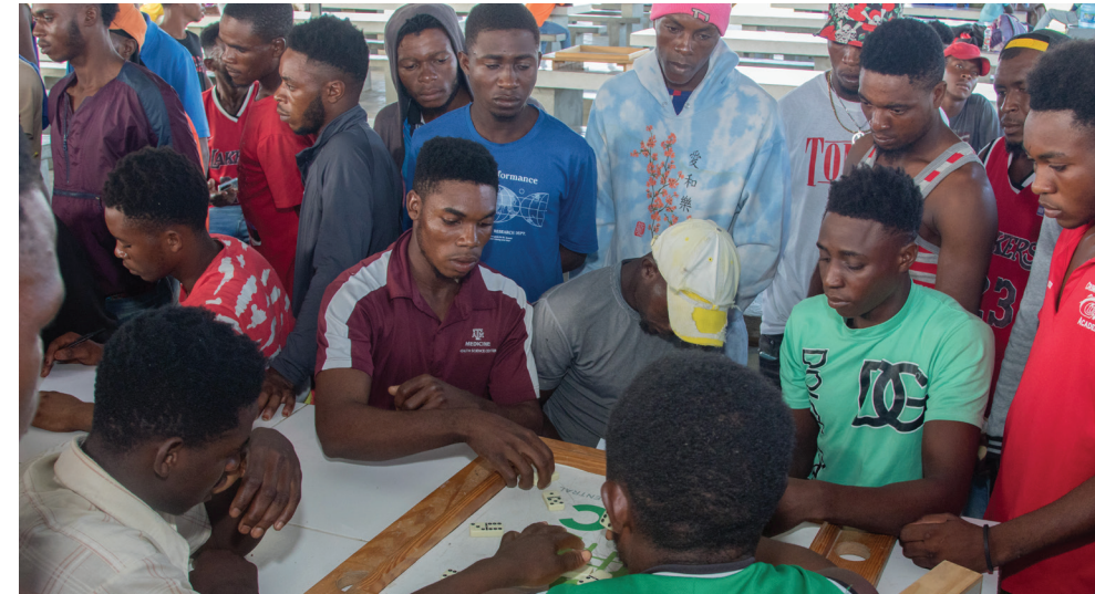
Muchos espectadores de las partidas jugadas en este Torneo de Dominó para los Picadores.

El Consorcio Azucarero Central (CAC), celebró próximo a finalizar la zafra azucarera un emocionante Torneo de Dominó en el complejo habitacional del área Agrícola, destinado a los colaboradores dedicados al corte manual de caña, nuestros Picadores. Este evento reunió a 16 participantes, organizados en 8 equipos, que compitieron por premios atractivos para su recreación en