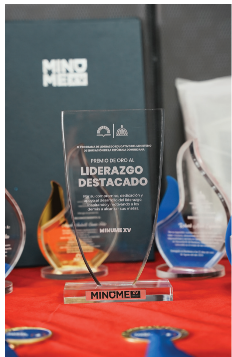
Muestra del trofeo del MINUME.

El JETC está sumamente orgullosos de sus estudiantes, sin duda, este año ha sido sumamente fructífero y el centro esta inmensamente agradecido por el compromiso y el apoyo de todos los actores de la Comunidad Educativa: docentes, padres, equipo de gestión, mentores y por supuesto, ¡por sus jóvenes líderes!, pues haber logrado esto ya los convierte en ganadores.