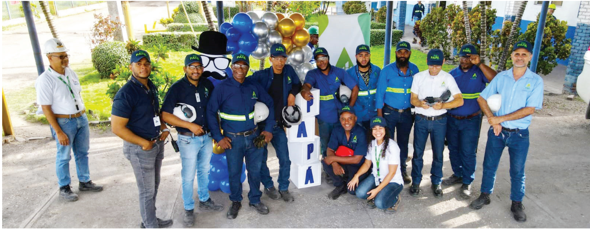
Padres del área Industrial recibieron su regalo en la víspera de su día.

El Día del Padre es el momento perfecto para reconocer y celebrar a todos los padres que, en diferentes áreas de nuestro ingenio azucarero, contribuyen con su esfuerzo y dedicación a los logros del Consorcio Azucarero Central (CAC). Desde los campos de caña de azúcar hasta las oficinas administrativas, cada uno juega un papel crucial en el funcionamiento de nuestra empresa.