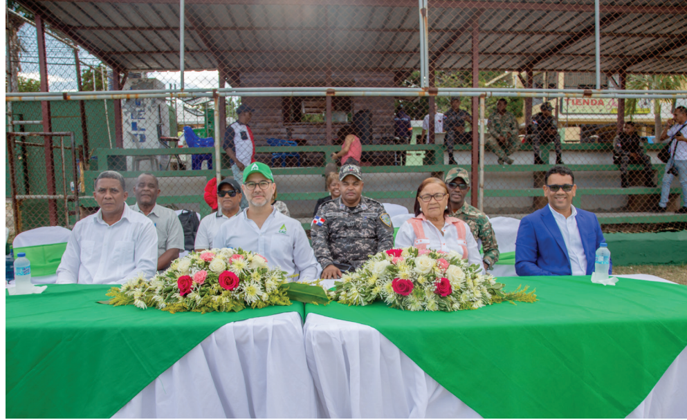
Integrantes de la mesa principal disfrutaron del acto inaugural.