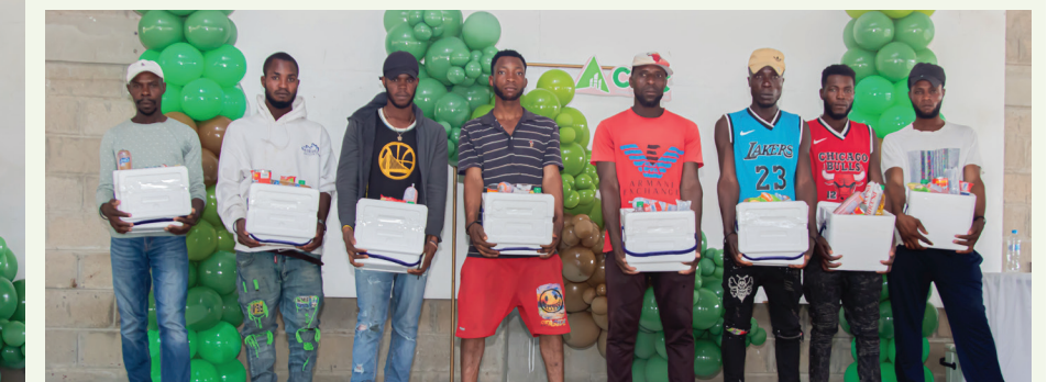
Se realizaron rifas de distintos artículos, incluyendo abanicos, kits de nevera surtida, y otros premios.