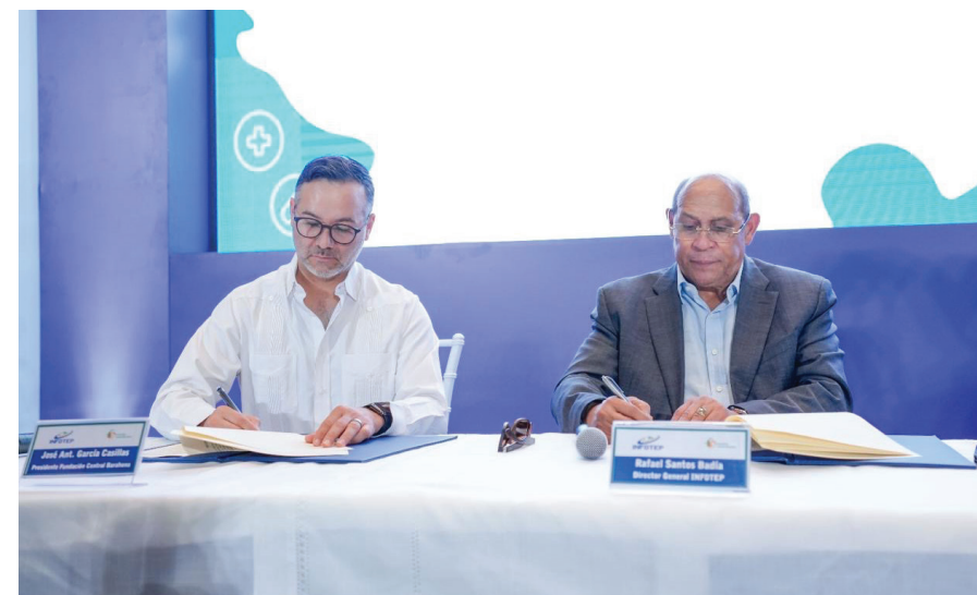
Firma del acuerdo interinstitucional entre FCB e Infotep.

El Instituto Nacional de Formación Técnico Profesional (INFOTEP) y la Fundación Central Barahona, el brazo social del Consorcio Azucarero Central, firmaron un acuerdo para ejecutar un plan de capacitación en beneficio de los residentes de las comunidades cañeras de las provincias Bahoruco, Independencia y Barahona.