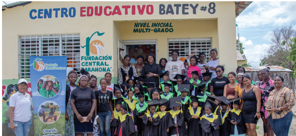
Estudiantes de la Escuelita de Batey 8 junto a sus maestras y madres.

Destacamos la labor que nuestro Consorcio Azucarero Central (CAC) realiza junto a su Fundación para promover la educación, el deporte y la recreación de los adultos del mañana, reafirmando como empresa nuestra postura "Contra el Trabajo Infantil".