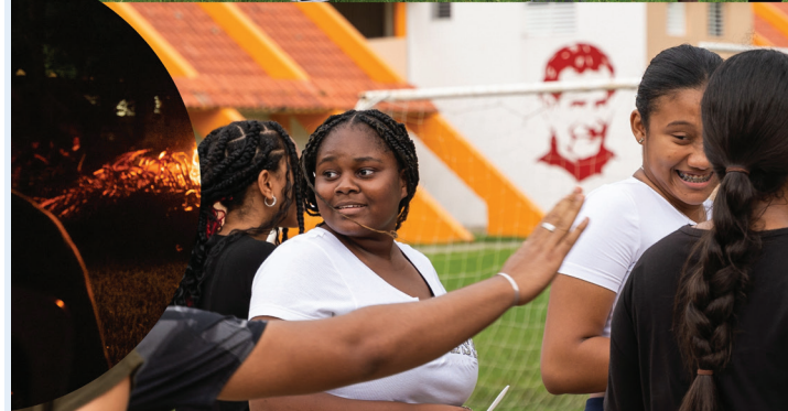
Mucha diversión entre compañeros creó experiencias inolvidables en los alumnos.

Entre las montañas del municipio de Constanza perteneciente a la provincia de La Vega, se llevó a cabo la primera convivencia escolar del Jesús en ti Confío (JETC) en Pinar Quemado, reuniendo a estudiantes de 4to, 5to y 6to de secundaria en un evento que fomentó el espíritu de comunidad; además, se presentó el nuevo programa TAPAF (Talleres que Abren Puertas Al Futuro).