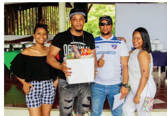
Somos una empresa dulce como nuestra Caña Linda, somos CAC.

Cada año, el Consorcio Azucarero Central se esfuerza por crecer y avanzar en unidad, haciendo de estas celebraciones un espacio no solo para festejar los logros, sino también para fortalecer los lazos entre los colaboradores y reconocer su dedicación. Sin duda, en este fin de zafra todos disfrutaron la celebración de los éxitos compartidos.