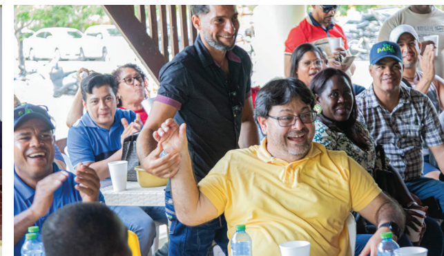
Las colaboradoras agradecieron los regalos y atenciones recibidas.