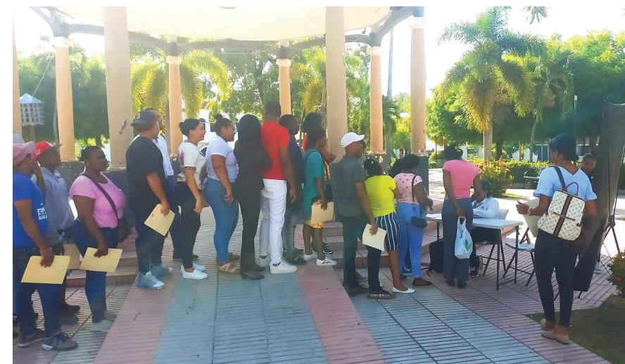
Un gran número de personas asistieron a los distintos lugares donde se realizó la feria en busca de ser parte del talento CAC.