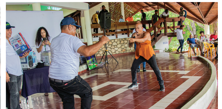
Vista de la gran asistencia en el Salón Multiusos.