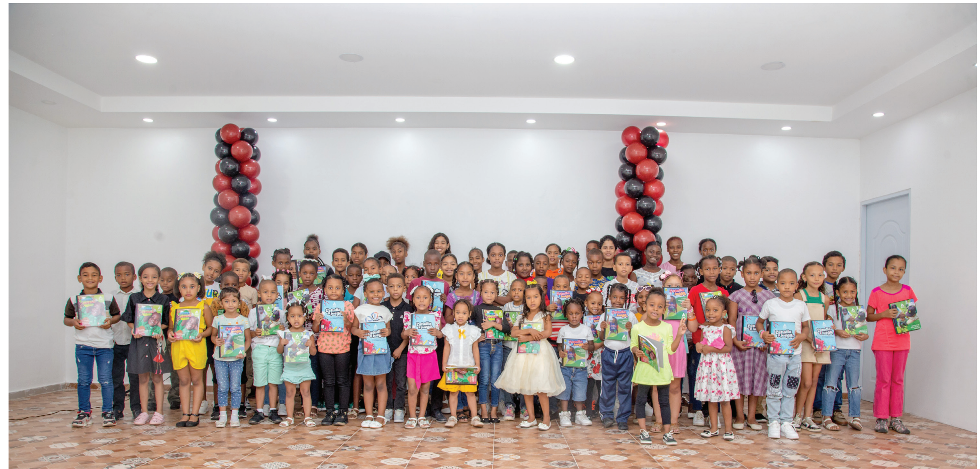
Cuadernos en manos de los hijos de los colaboradores del CAC al finalizar la proyección de la película en las oficinas Administrativas.

El CAC cada año da un bonito ejemplo de compromiso social al regalar cuadernos personalizados a los hijos de sus colaboradores, con edades entre 4 y 12 años, acompañándolos así en el inicio de cada nuevo trayecto escolar.