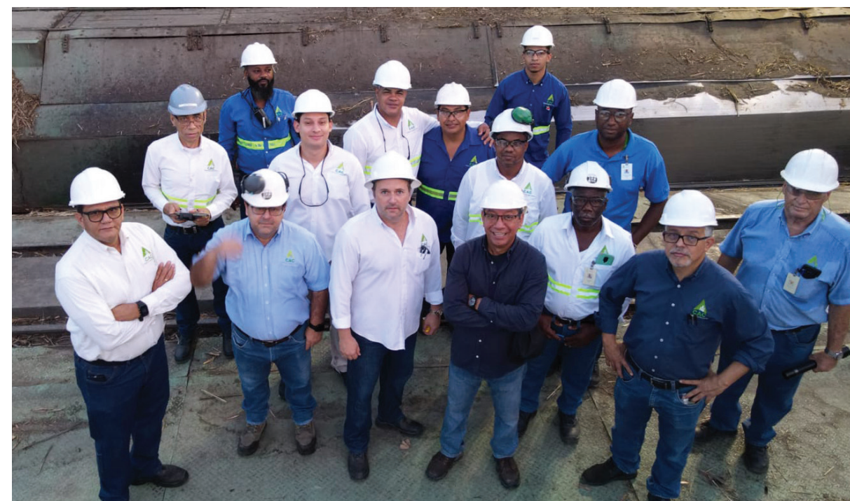
Equipo de operaciones y algunos administrativos juntos en el amanecer del último día de Zafra.

Con la zafra 23-24, el CAC reafirma su compromiso con el desarrollo económico y social de la región suroeste de la República Dominicana. La empresa azucarera, además de su producción récord, se ha posicionado como un pilar clave para el bienestar de sus colaboradores y el progreso de la comunidad local.