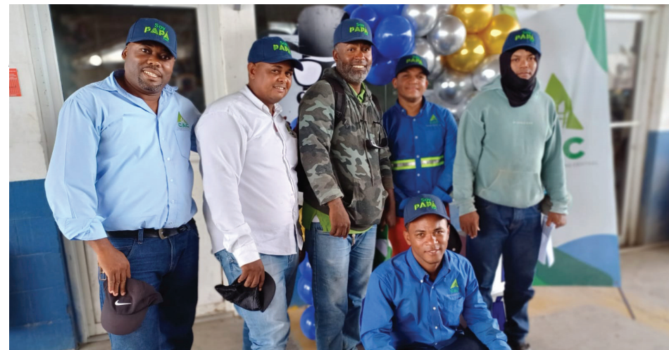
Ellos son Papá CAC.

En este Día del Padre Dominicano, destacamos el valioso aporte de todos los padres que forman parte de nuestra gran familia CAC. Su esfuerzo y dedicación no pasan desapercibidos, y les agradecemos por todo lo que hacen, en sus diferentes facetas.