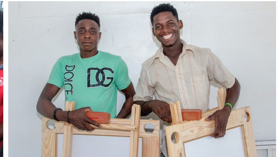
Los ganadores recibieron premio de entretenimiento.

Los enfrentamientos se desarrollaron con un ambiente de camaradería y competitividad, los colaboradores disfrutaron de una jornada llena de risas y compañerismo, fortaleciendo los lazos entre ellos. La realización de este