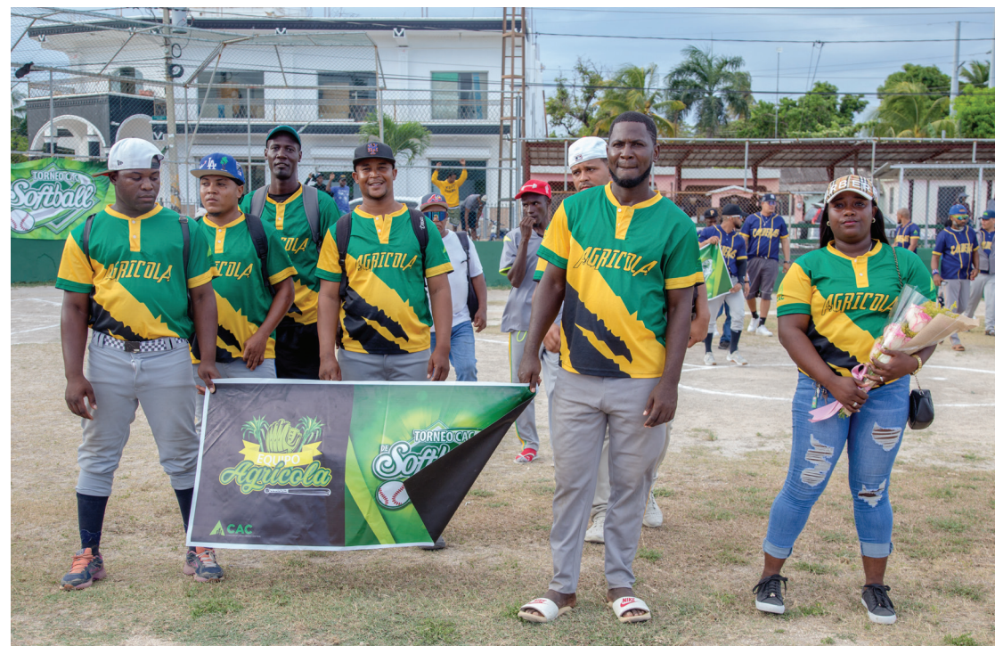
Parte del equipo de Agrícola junto a su madrina.