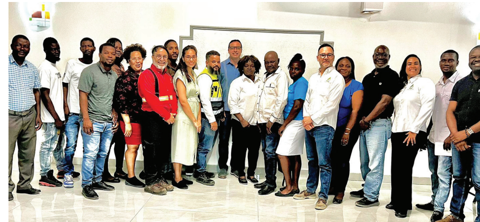
Asistentes de la MEISA.