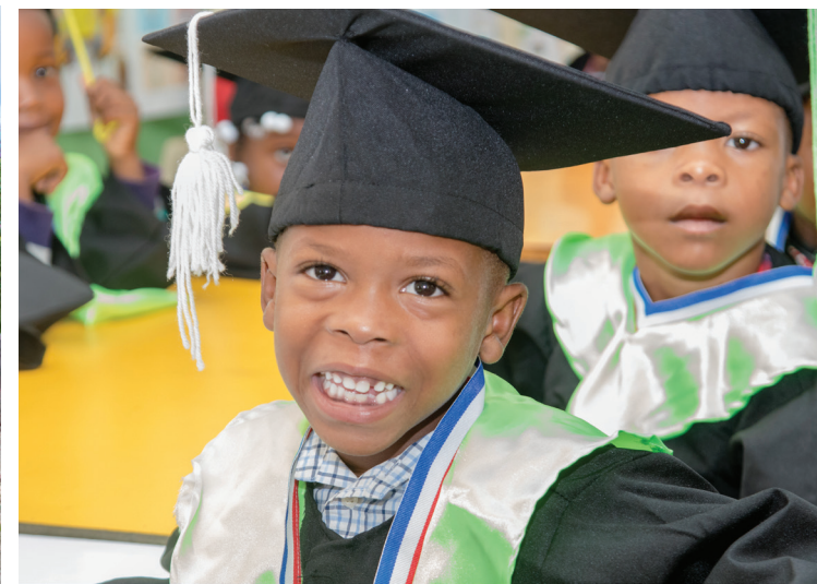
Sus sonrisas son nuestra felicidad.

Con mucha alegría fue celebrado el cierre del período escolar 2023-2024 en las escuelas comunitarias del Programa de Educación Inicial patrocinadas por la Fundación Central Barahona (FCB), brazo social del Consorcio Azucarero Central.