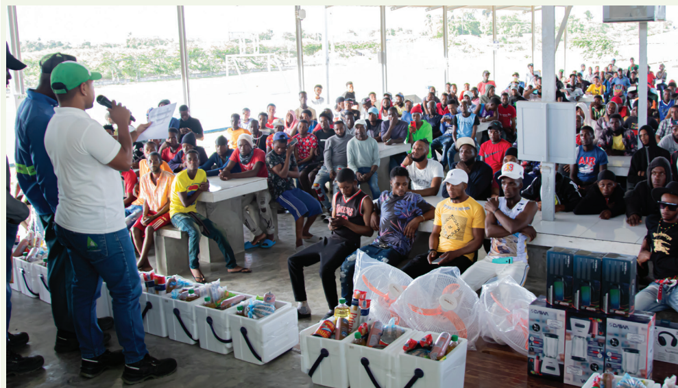
Vista del público que disfrutó los bailes, cantos y premiaciones.

El Consorcio Azucarero Central (CAC), como cada año, reconoce y valora a sus empleados de Corte Manual (Picadores) en esta segunda edición de las premiaciones al cierre de la Zafra 23-24, celebrada en el mes de julio. Este evento tiene como objetivo homenajear la dedicación y el compromiso de los Picadores, quienes representan el motor que impulsa la producción de azúcar en nuestra operación.