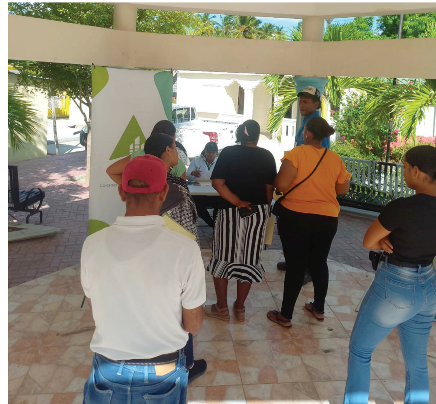
Feria de empleo CAC en Palo Alto.