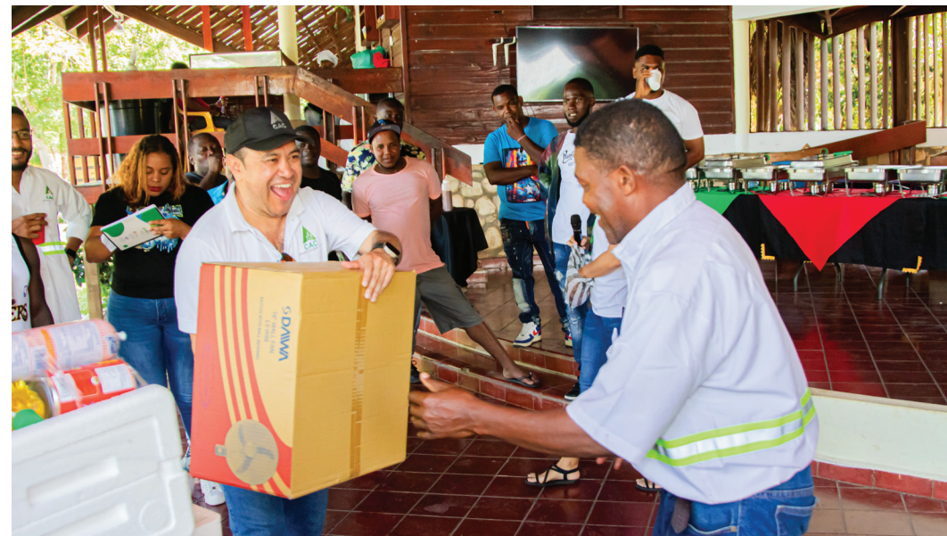
Con alegría los colaboradores recibieron los dulces y chocolates en el área Industrial a primera hora de la mañana.

Garantizar los derechos de salud y bienestar de todos nuestros colaboradores es una prioridad.