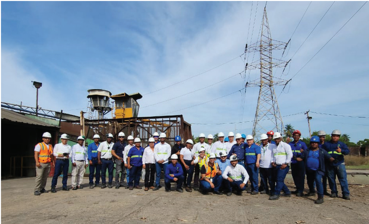
Personal en el área Industrial frente a la zona donde se vació el último vagón de la zafra 23-24.

En una zafra azucarera sin precedentes, el CAC logró romper los récords de caña molida y de azúcar producida, el incremento en la producción azucarera impulsa la economía local y contribuye a consolidar el sector agrícola e industrial en la región.