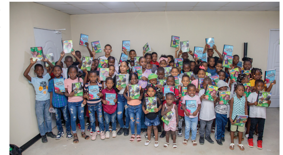
También en las oficinas en Agrícola, los hijos de los colaboradores disfrutaron del cine y se llevaron además de la experiencia sus cuadernos.

La entrega de cuadernos es parte del compromiso continuo del Consorcio Azucarero Central, quienes cumplen y superan las expectativas de lo establecido en su Convenio Colectivo de Condiciones de Trabajo. Tomando en consideración que cada pequeño gesto cuenta, y con el deseo de que todos los hijos de sus colaboradores empiecen el año escolar con entusiasmo y recursos suficientes.