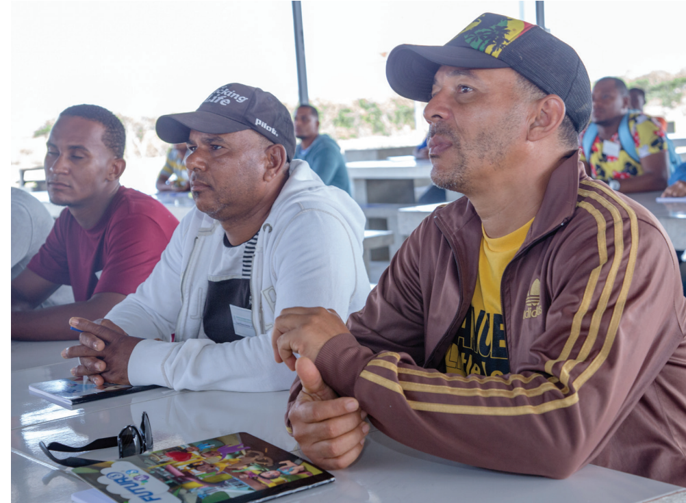
Gran asistencia tuvo el acto inaugural para iniciar las capacitaciones de la Escuela de Choferes CAC.