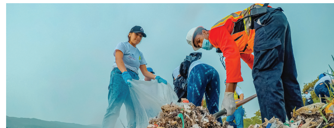
La lluvia no detuvo a los voluntarios de la Jornada de Limpieza de Playas para recoger los desperdicios.

El Consorcio Azucarero Central (CAC), se unió a la celebración del Día Internacional de Limpieza de Playas y Costas, con la realización de la jornada de limpieza en la Playa Casita Blanca de esta provincia Barahona, donde participaron más de 100 voluntarios conformado por colaboradores quienes integraron a sus familias (esposas, esposas, e hijos) y en apoyo al Ministerio de Medio Ambiente y Recursos Naturales.