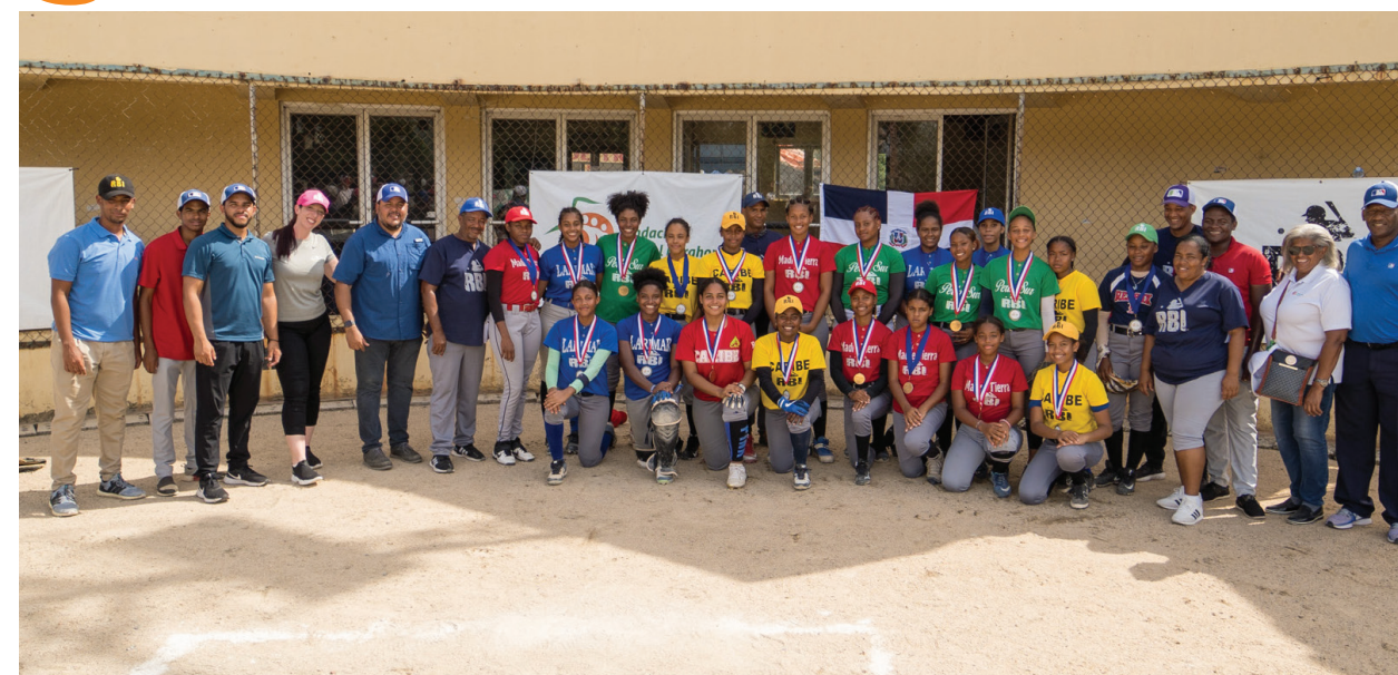
Equipo de softball femenino triunfa en su categoría Torneo Nacional RBI 2022, las acompañan la Fundación Central Barahona y el equipo técnico de MLB.

Jugadores de la región Sur hicieron un gran trabajo en el terreno de juego, consiguiendo medallas de este campeonato.