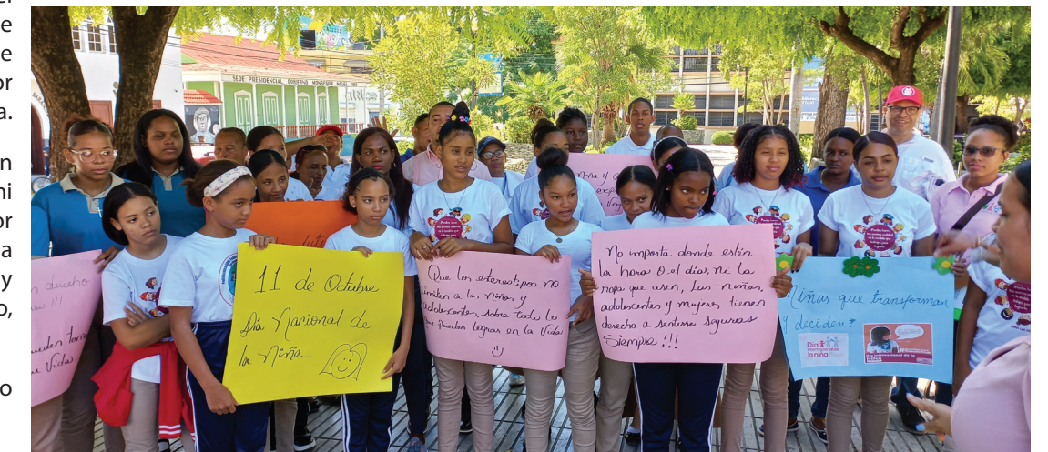
Niñas y jóvenes durante el acto que conmemoró su día.

La Fundación Central Barahona brazo social del Consorcio Azucarero Central, apoya el deporte en distintas disciplinas, siendo la principal su programa RBI junto a la Major League Baseball. Además, apoya las acciones que concentran a los niños y jóvenes que merecen tener esparcimiento y espacios sanos para su desarrollo.