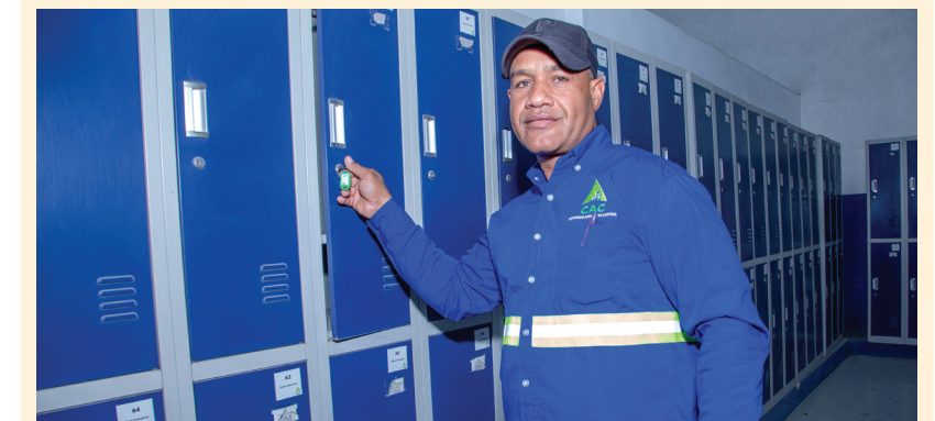
Colaborador posa junto a unos de los casilleros.