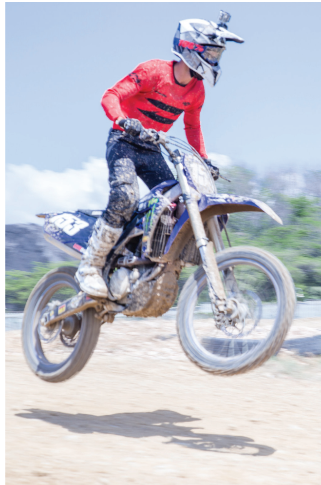
La adrenalina fue protagonista en la pista del rally de Cocodrilo Racing Club.

Con la participación de más de 500 pilotos provenientes de diferentes puntos del país, así como de Puerto Rico y Haití, fue realizado el evento off road Ruta Larimar, con un enfoque totalmente ecoturístico y en el que el Consorcio Azucarero Central (CAC) dijo presente por 3era. ocasión.