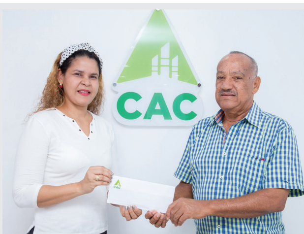
Miembros del Comité organizador recibieron el aporte del CAC para las fiestas.

El 07 de octubre es el Día de Nuestra Señora del Rosario, patrona de la provincia Barahona y en torno a esto, este año se organizaron fiestas religiosas, culturales y deportivas que abarcaron todos los barrios populares y que representan la idiosincrasia del pueblo barahonero.