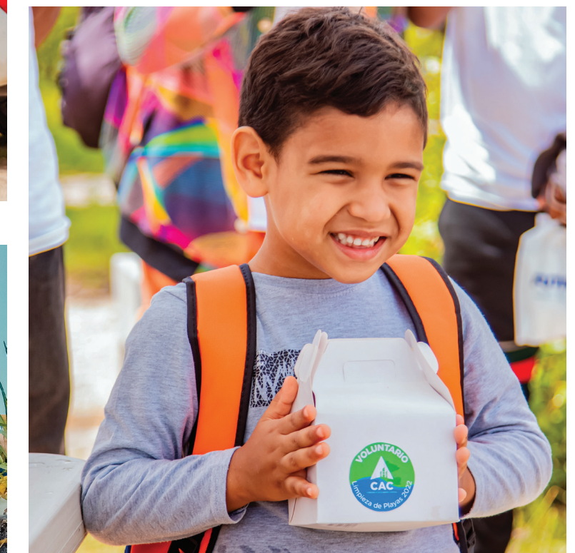
La Limpieza de Playas incluye a toda la familia.

En la jornada participaron empleados de las áreas de Administración, Fábrica, Agrícola y Centro de Servicios de la empresa azucarera, junto a sus familias, quienes desde ya son parte del voluntariado para las actividades de responsabilidad social que desarrolla la empresa.