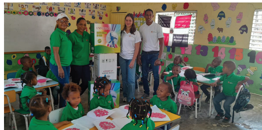
Acto de apertura del Ciclo Escolar 2022-2023 de la escuela de Batey 6.

Las Escuelitas, como cariñosamente se les llama, son un espacio de formación de entes sociales que representan el futuro de sus comunidades, niños y niñas cuyos padres confían su educación en la primera infancia y la Fundación vela por que la educación que se ofrece sea de la mejor calidad para ellos.