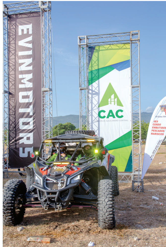
Uno de los cientos de buggies que participaron en la Ruta Larimar.