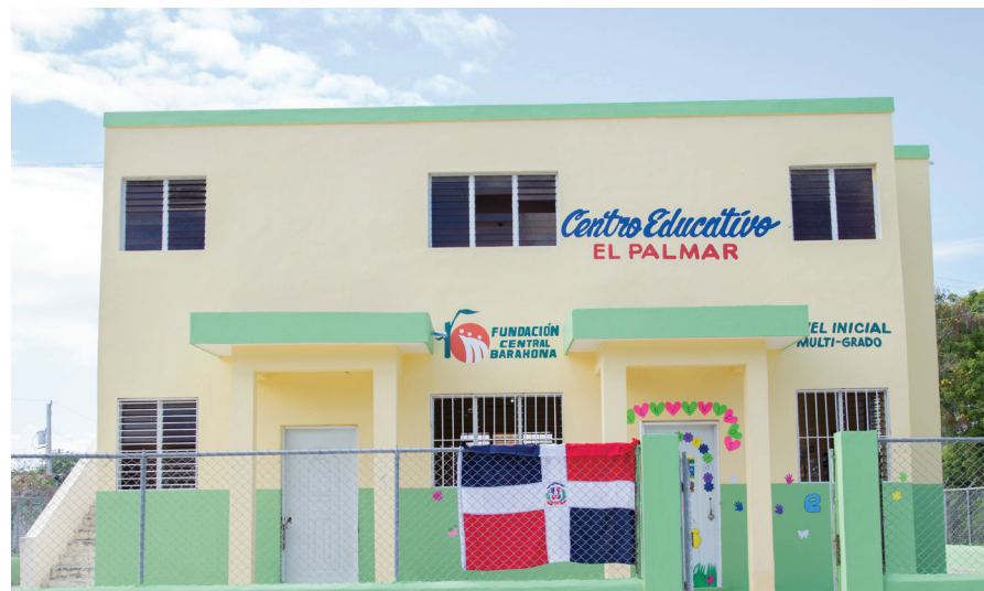
Fachada del centro educativo