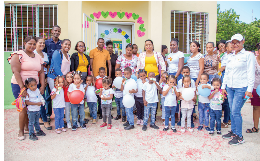
Niños que asistirán a la Escuela de Educación Inicial de El Palmar junto a sus padres.