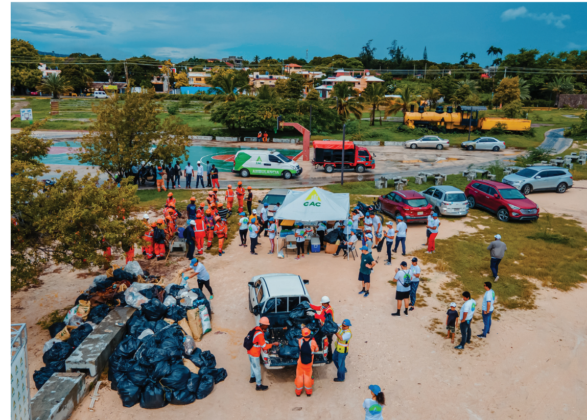
Limpiamos hoy para tener un mejor mañana. Vista aérea de los desperdicios colectados tras la limpieza.