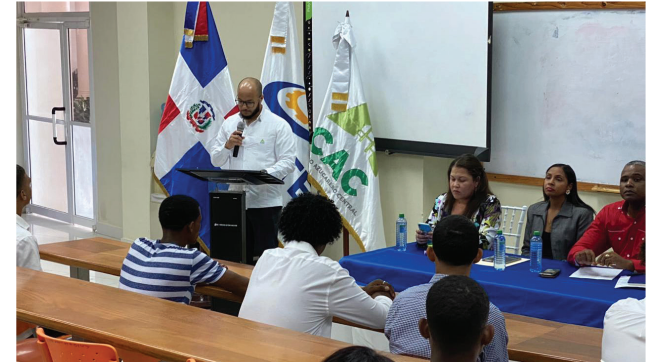
Acto de apertura al Programa Dual realizado en el recinto de la UASD Barahona.

Un total de 10 jóvenes fueron seleccionados para participar en este programa que tendrá la duración de 1 año, donde agotarán unas 1,200 horas, recibiendo información teórica por el INFOTEP y completarán las horas prácticas en las instalaciones del área Industrial CAC, contando con la supervisión de un técnico calificado, con experiencia y formación para aplicar el proceso de la enseñanza práctica, asegurando la calidad de la información del proceso en dicha área.