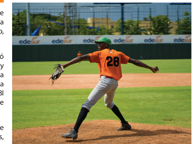
Jugadores entre 14 y 18 años demostraron su talento en el Estadio Quisqueya de Santo Domingo, logrando estos últimos cautivar a los scouts de equipos de grandes ligas que formaban parte del público.

La Fundación Central Barahona invirtió en todas las actividades deportivas de este programa en el 2022, RD$1,765,000 pesos. Apostados al desarrollo físico y mental de nuestros niños y jóvenes en el Sur.