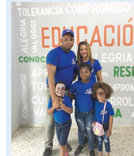
Familia vestida de su equipo favorito, pues la temática del Día Familiar era de equipos de beisbol.