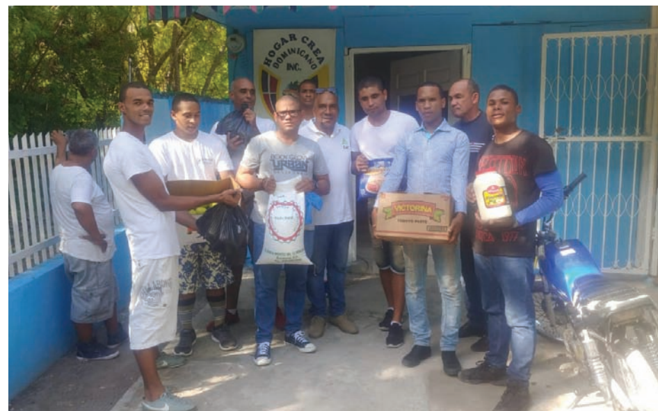
Hogar Crea Dominicano también recibió aportes.

Dichos aportes, consistieron en órdenes de compras para alimentos crudos, los cuales forman parte de la mesa dominicana en las navidades. Dentro de los productos se les