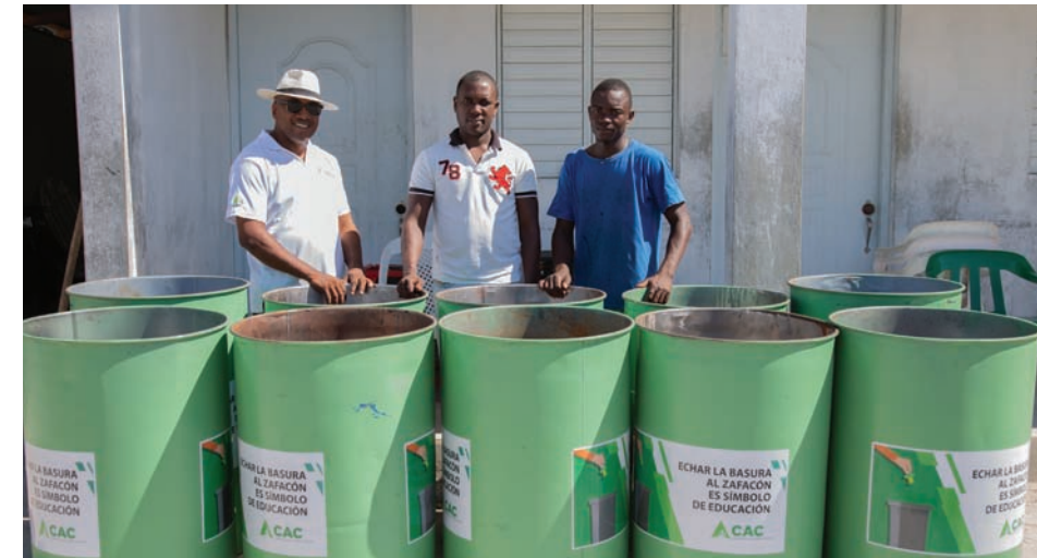
Comunitarios reciben los depósitos de basura.

Desde el año 2018, el CAC ha venido desarrollando el proyecto "Mi Comunidad Limpia", que consiste en la entrega y donación de depósitos de basura para todas las comunidades de la zona cañera, superando los 330 depósitos durante el año 2019