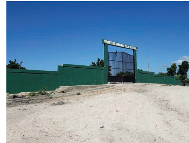
Fachada frontal del Cementerio Municipal.