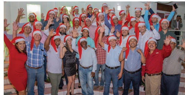
Gerentes y superintendentes, fueron sorprendidos con el espíritu de la navidad en su participación en una formal presentación laboral.

Durante la temporada navideña el CAC realizó distintas actividades de integración con las diferentes áreas que componen la empresa, utilizando conceptos como Angelito Navideño (intercambio de regalos), Team Work (entre las gerencias de Agrícola, Centro de Servicios y Fábrica), cena de Presentación de Resultados y Objetivos 2020 (dirigida a nivel gerencial), así como también se invitó al personal administrativo una cena navideña y donde se hizo un reconocimiento a colaboradores por antigüedad.