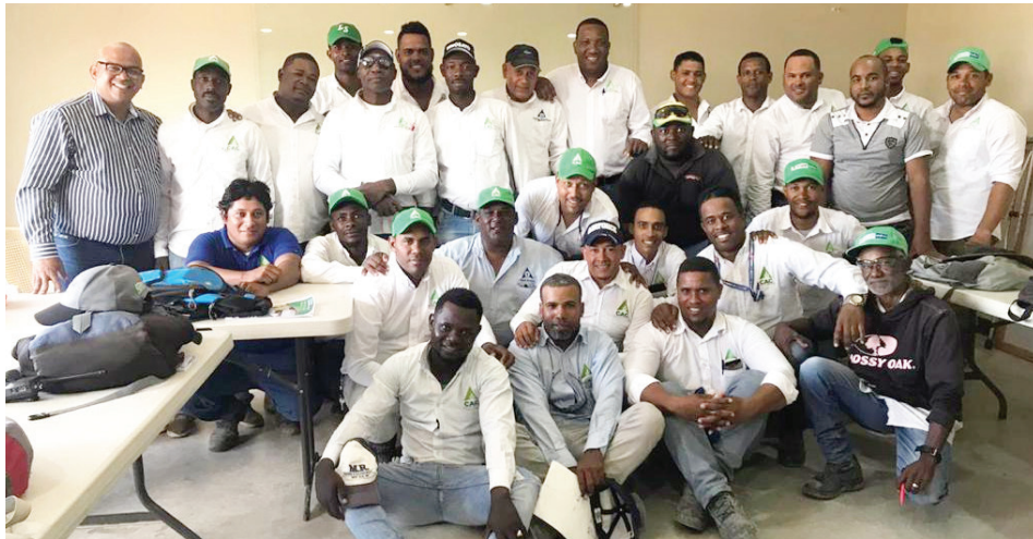
Participantes del curso de Riego Tradicional.

El entrenamiento es conocido como el proceso mediante el cual se le proporcionan medios a los empleados para adquirir y desarrollar de forma más rápida conocimientos y habilidades; de esta manera trae consigo múltiples beneficios como preparar el personal para que pueda ejecutar de forma inmediata diferentes tareas.