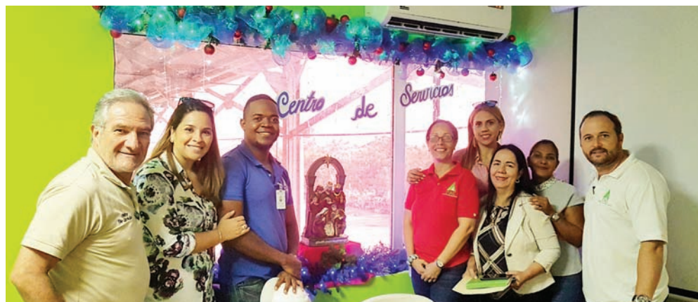
Equipo del Centro de Servicios posa junto al jurado en un área de las decoradas.

En el fin de año del 2019, se realizó por primera vez un concurso para motivar el espíritu navideño de los colaboradores, el cual fue organizado por el Departamento de Gestión Humana del Consorcio Azucarero Central (CAC), quienes enviaron las pautas para participar, y 7 departamentos se inscribieron oficialmente en el concurso.