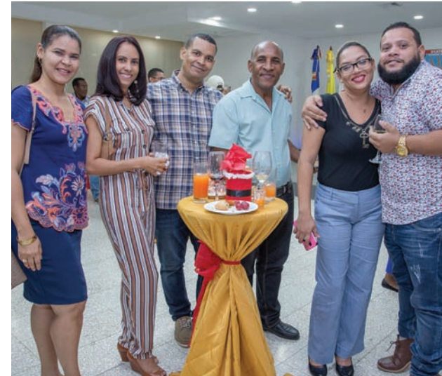
Periodistas comparten en un ambiente de familiaridad.

Además, expresó su satisfacción por el trabajo que han venido realizando los periodistas de la Región, al demostrar un ejercicio apegado a la ética.