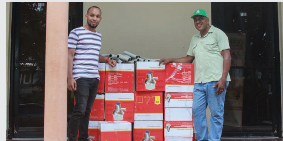
Personal del Ayuntamiento de Tamayo reciben las lámparas donadas

Con esta entrega, el CAC mantiene su interés de apoyar a las comunidades con su desarrollo a través de la cobertura de las necesidades que hayan sido identificadas por las alcaldías y juntas de distritos municipales.