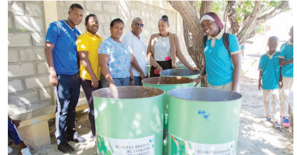
Profesores y estudiante reciben aporte que contribuye a la limpieza de su escuela.

Solo durante los meses de noviembre y diciembre, el CAC entregó 200 depósitos distribuidos en las siguientes comunidades: