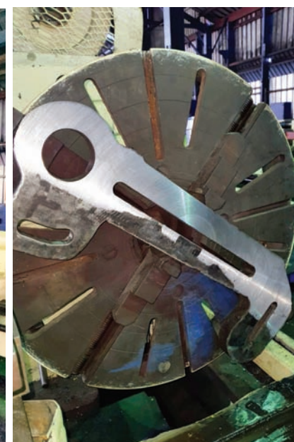
El torno visto desde el lado frontal.