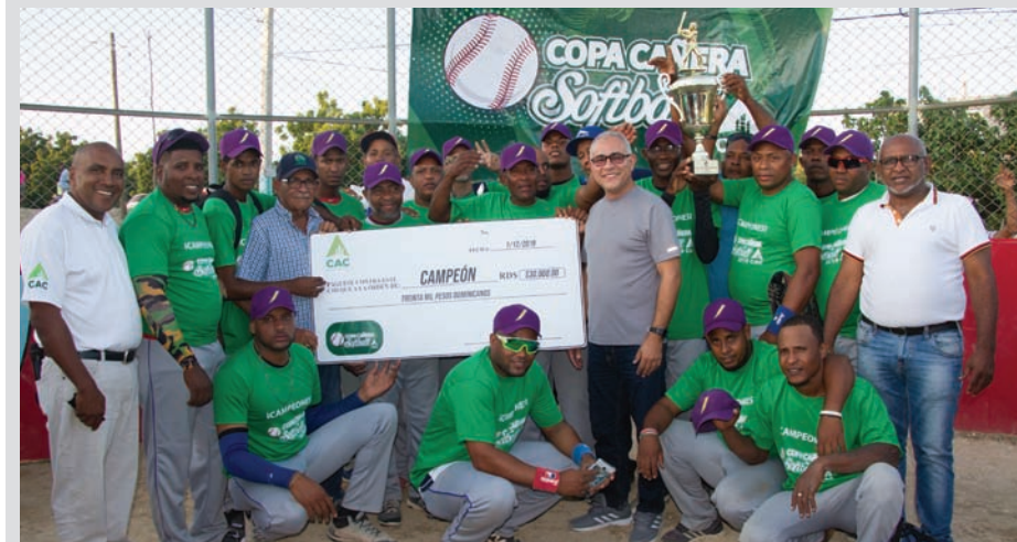
Equipo de Jaquimeyes, campeón Copa Cañera de Softball CAC 2019.

El CAC concluyó su Copa Cañera de Softball CAC 2019, donde se coronó campeón el equipo de Jaquimeyes, tras debatirse en una serie de 3-2 contra el equipo de La Guázara.