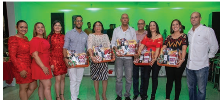
Gestión Humana premia a los empleados de mayor antigüedad durante la cena del área Administrativa.