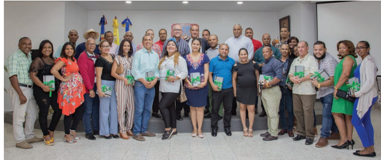
Grupo de periodistas que asistieron a la actividad.

El Consorcio Azucarero Central (CAC), celebró un encuentro con comunicadores y periodistas de las provincias Barahona, Bahoruco e Independencia, para darle la bienvenida a la Navidad, época de compartir con amigos, rebotando de alegría, paz y armonía.