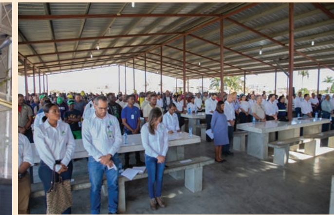
Con gran asistencia se contó en la celebración de la misa.

La misa que contó con la presencia cientos de empleados, así como de directivos de la empresa, fue oficiada por