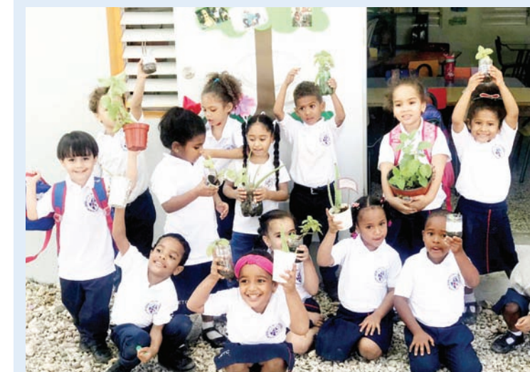
Estudiantes de Kinder muestran las plantas medicinales que están cuidando.

En la primera etapa del proyecto de siembra "Barahona Verde y Productiva" que desarrolla la Comunidad Educativa Jesús En Ti Confío, y con el apoyo de los padres y madres, los niños llevaron al plantel siembras de plantas medicinales en tarros con el compromiso de cuidarlas, y cuando éstas broten y estén en perfectas condiciones, puedan la replantarlas en su hogar.