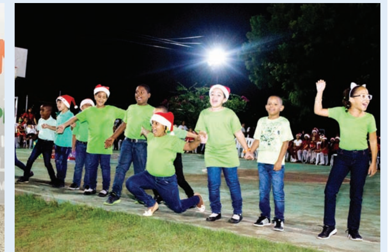
Niñas y niños durante su presentación navideña.

Es importante mantener las buenas tradiciones y que estas pasen de generación en generación; por esto la Comunidad Educativa Jesús En Ti Confío (JETC) realiza durante el año escolar distintas actividades para cultivar en sus estudiantes los valores que vienen con estas tradiciones.