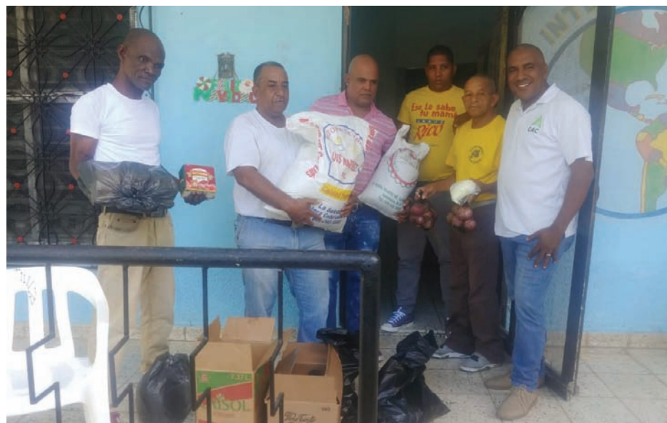
Hogar Crea internacional recibe alimentos para su cena navideña.

Para el Consorcio Azucarero Central (CAC) es importante aportar a las causas de bien social, el CAC cree en las oportunidades y los derechos, es por esto que, en una época de renacimiento y reconciliación como lo es la navidad, la empresa colaboró con Hogar Crea internacional y Hogar Crea Dominicano en Barahona.