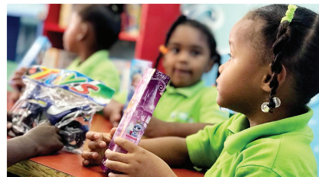
Estudiantes del CTC que patrocina la fundación, también recibieron juguetes.

Al llegar las vacaciones de navidad, la Fundación Central Barahona (FCB) realizó una despedida para los niños y niñas de las escuelas del Programa de Educación Inicial que estos patrocina, junto al Consorcio Azucarero Central (CAC).