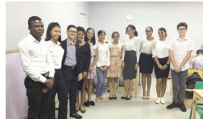
Alumnos de nivel secundario participantes en el MUN.

El Modelo de las Naciones Unidas, más conocido como MUN, es un evento educativo y cultural, en donde los jóvenes participan en una simulación de las Naciones Unidas y les permite desarrollar al máximo sus habilidades de negociación, diplomacia, análisis, investigación y de hablar en público.