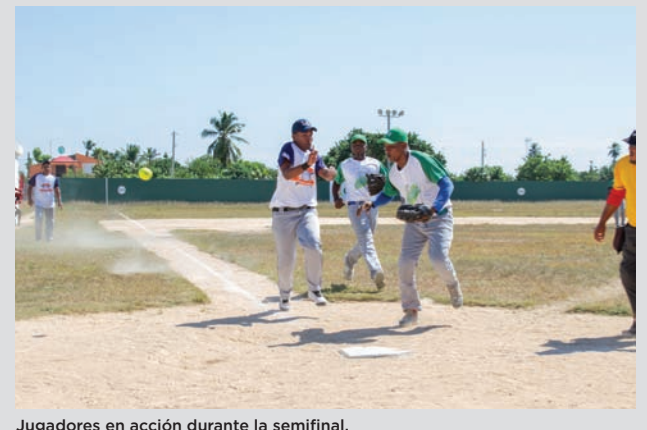
Jugadores en acción durante la semifinal.

La Copa Cañera de Softball CAC 2019 es un evento deportivo único realizado en la zona cañera, donde participaron 16 de equipos de las comunidades donde el CAC tiene incidencia.