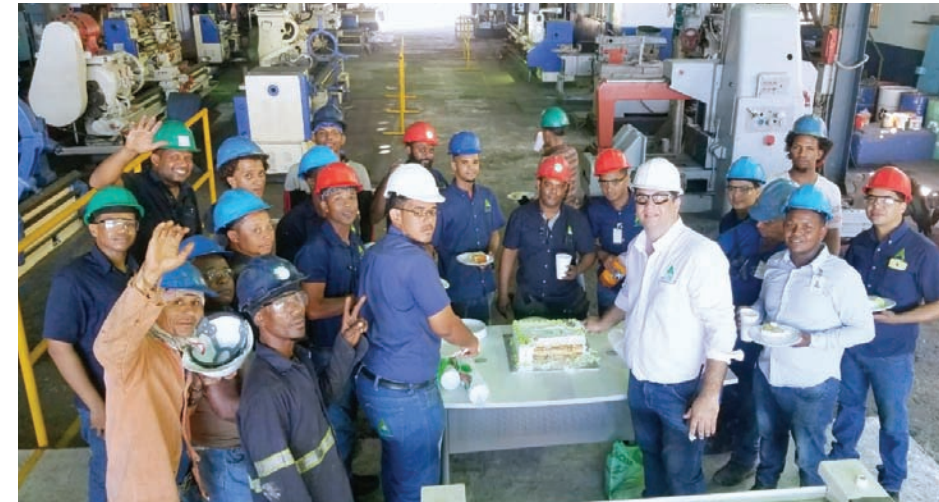
El personal compartió en este evento con orgullo y felicidad.