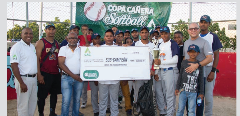
Equipo de La Guázara, subcampeón Copa Cañera de Softball CAC 2019.

El encuentro deportivo se disputó en el play de Jaquimeyes, donde la algarabía y alegría se hizo presente en todos los espectadores.