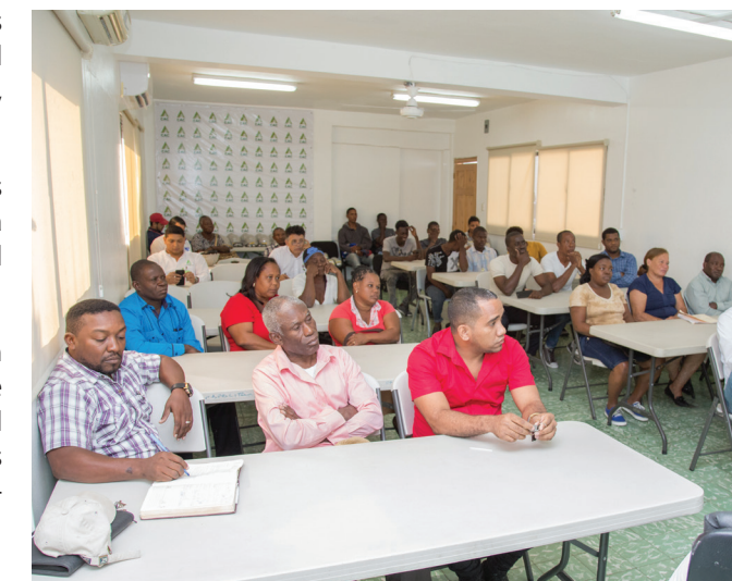
Grupo de comunitarios atienden las explicaciones de directivos del CAC.