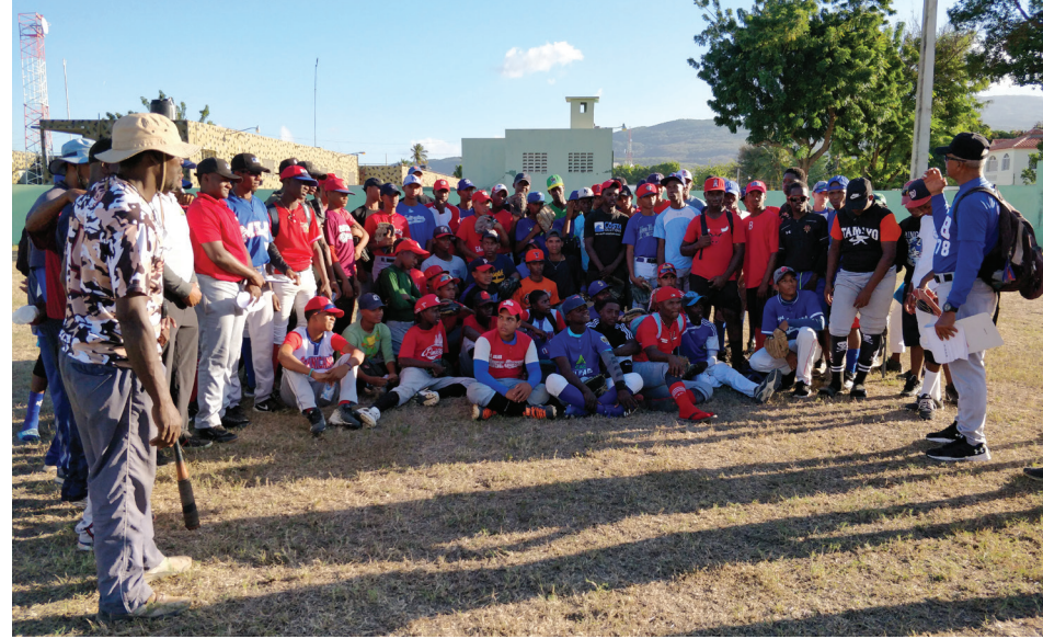
Algunos de los participantes de los tryouts.