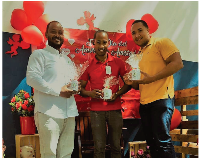
Los chicos de Tecnología también posaron para las cámaras.