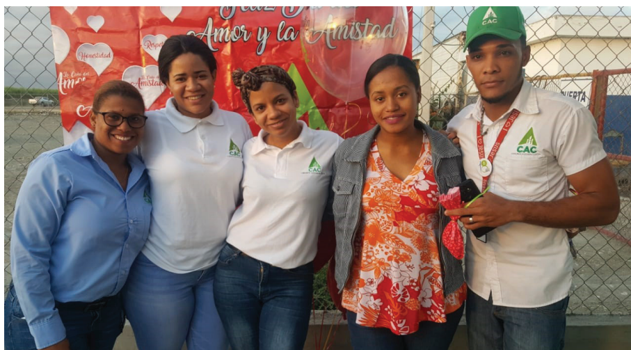
En Agrícola se siente el sentimiento de la amistad.