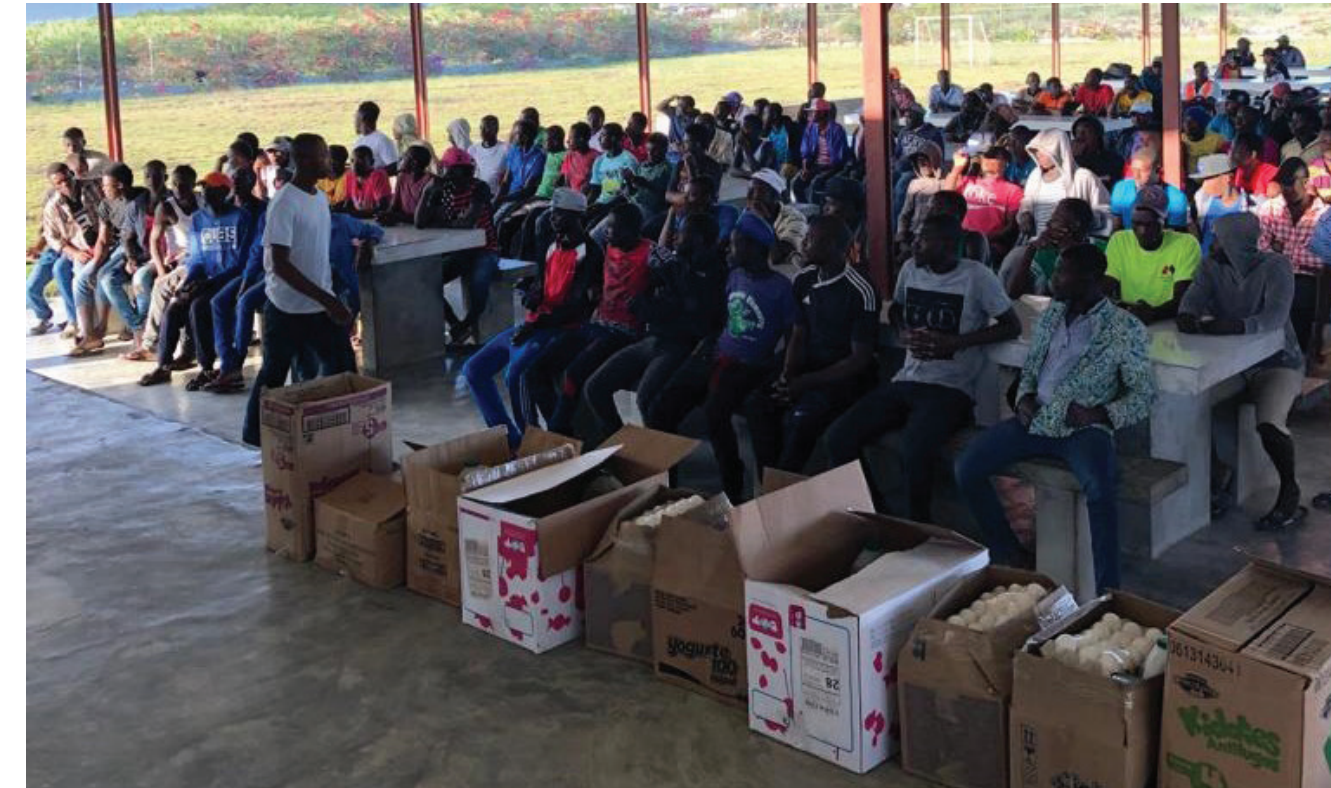
Más de 420 colaboradores de corte manual se dieron cita en la actividad.