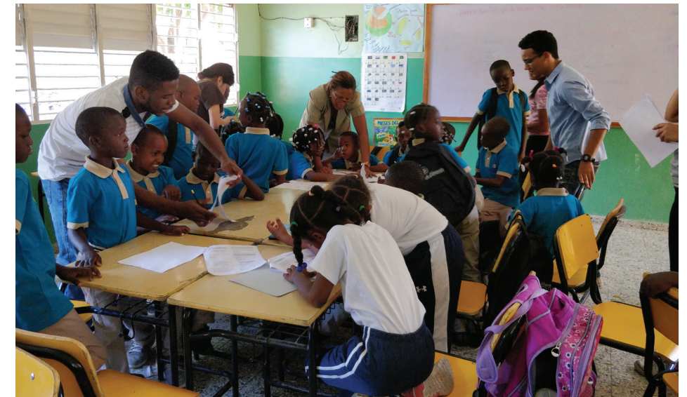
Niñas y niños reciben refuerzo educativo por parte de jóvenes de último año del Colegio Jesús en Ti Confío.

Este programa surgió desde el año 2015 como una necesidad de elevar la formación educativa en los centros donde asisten un gran número niños (as) y adolescentes pertenecientes al Programa RBI-Barahona, y ha tenido un impacto directo sobre 11 escuelas ayudando así a un total de 240 estudiantes.