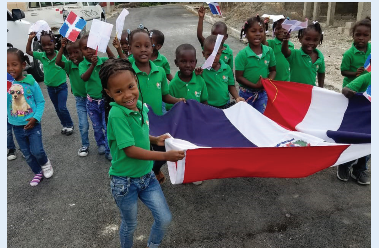
Estudiantes desfilan con la bandera nacional

Es importante recordar que en el Programa de Educación Inicial los niños y niñas de las comunidades, no solo reciben educación y estimulación temprana, sino que también se les aporta el desayuno con alimentos como harina de maíz, huevos, leche; además se les provee de uniforme y material didáctico para facilitar el proceso enseñanza-aprendizaje, sin que conlleve costo alguno para los padres.