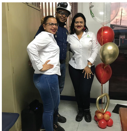
Colaborador del área Industrial sonríe feliz al recibir su detalle.