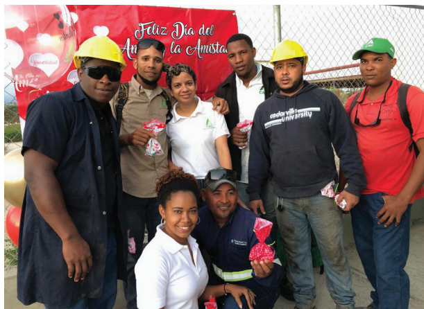
Personal de distintos departamentos en el área Agrícola, reciben el detalle que les llevó Gestión Humana.