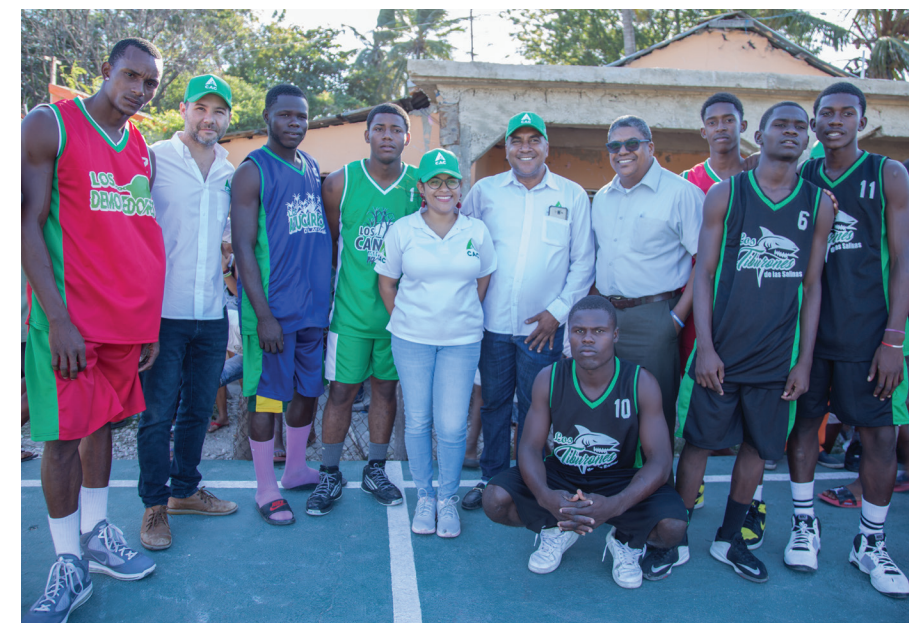
Jugadores y ejecutivos del CAC durante el acto inaugural.