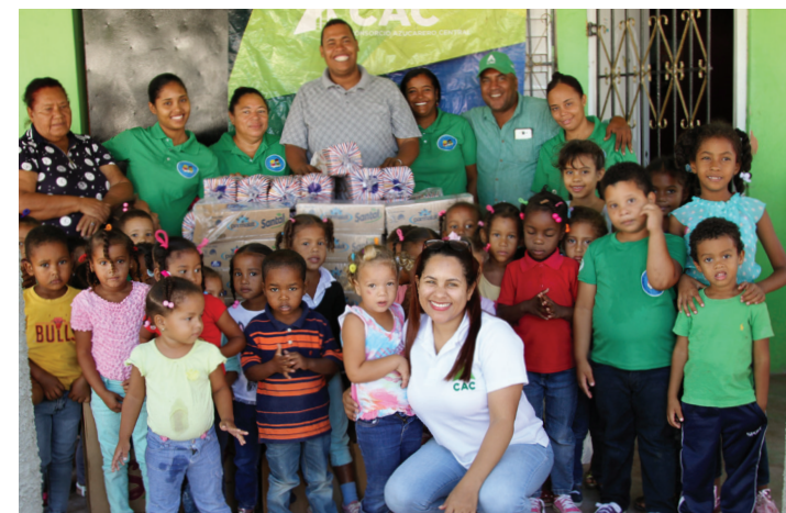
Rostros de felicidad expresan las sonrisas de los niños al recibir el aporte del CAC.