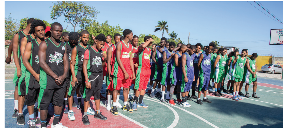
Un total de 48 jóvenes participan en este torneo donde se disputarán la Copa CAC de Básquetbol.