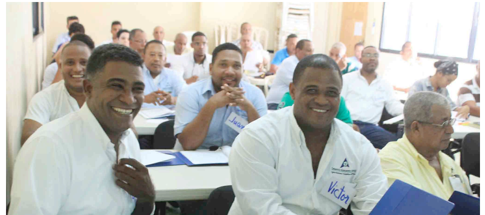
Supervisores de las diferentes áreas del CAC participaron del taller.