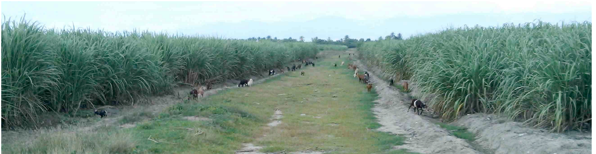
Chivos y vacas son los animales que más dañan los cultivos de caña de azúcar del Consorcio Azucarero Central.