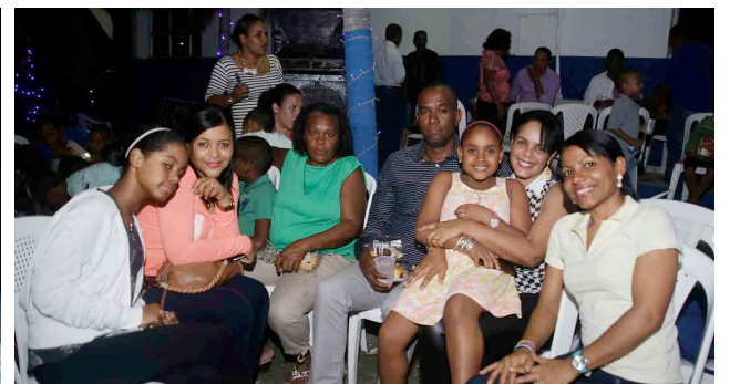
Las familias se reunieron para disfrutar de este encuentro navideño.