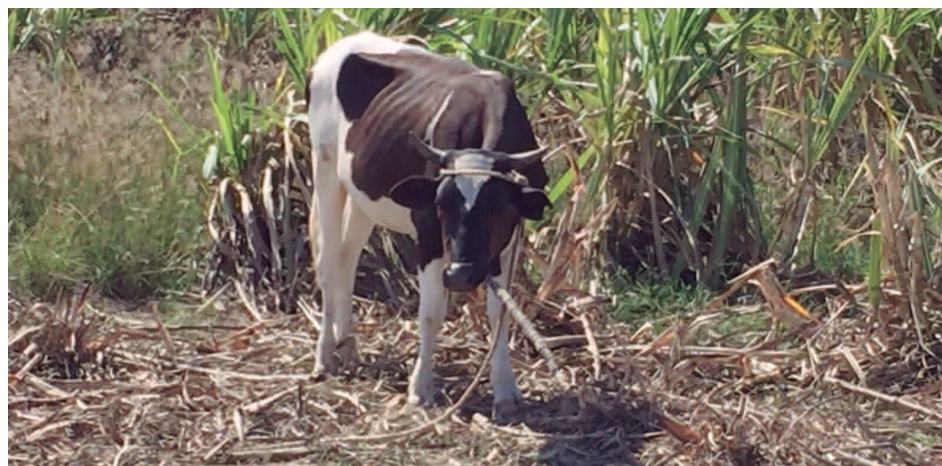
En la foto se observa una vaca comiendo caña en un campo cultivado del Consorcio Azucarero Central.

“El abuso por parte de los ganaderos formales e informales ha llegado al extremo de pastorear el ganado por las noches y dejarlo amanecer dentro de los campos de caña”, expresó Contreras.