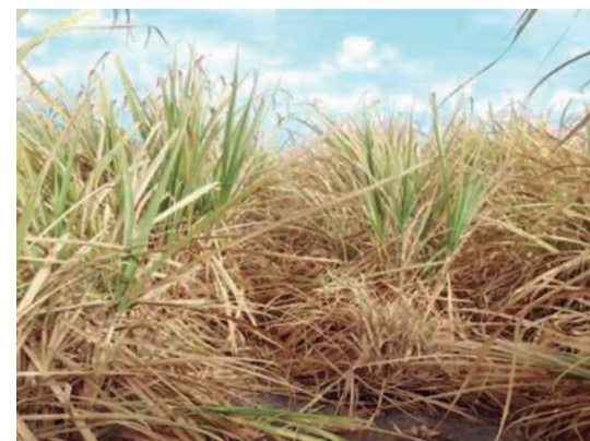
Cañaverales en muy mal estado por la falta de agua.