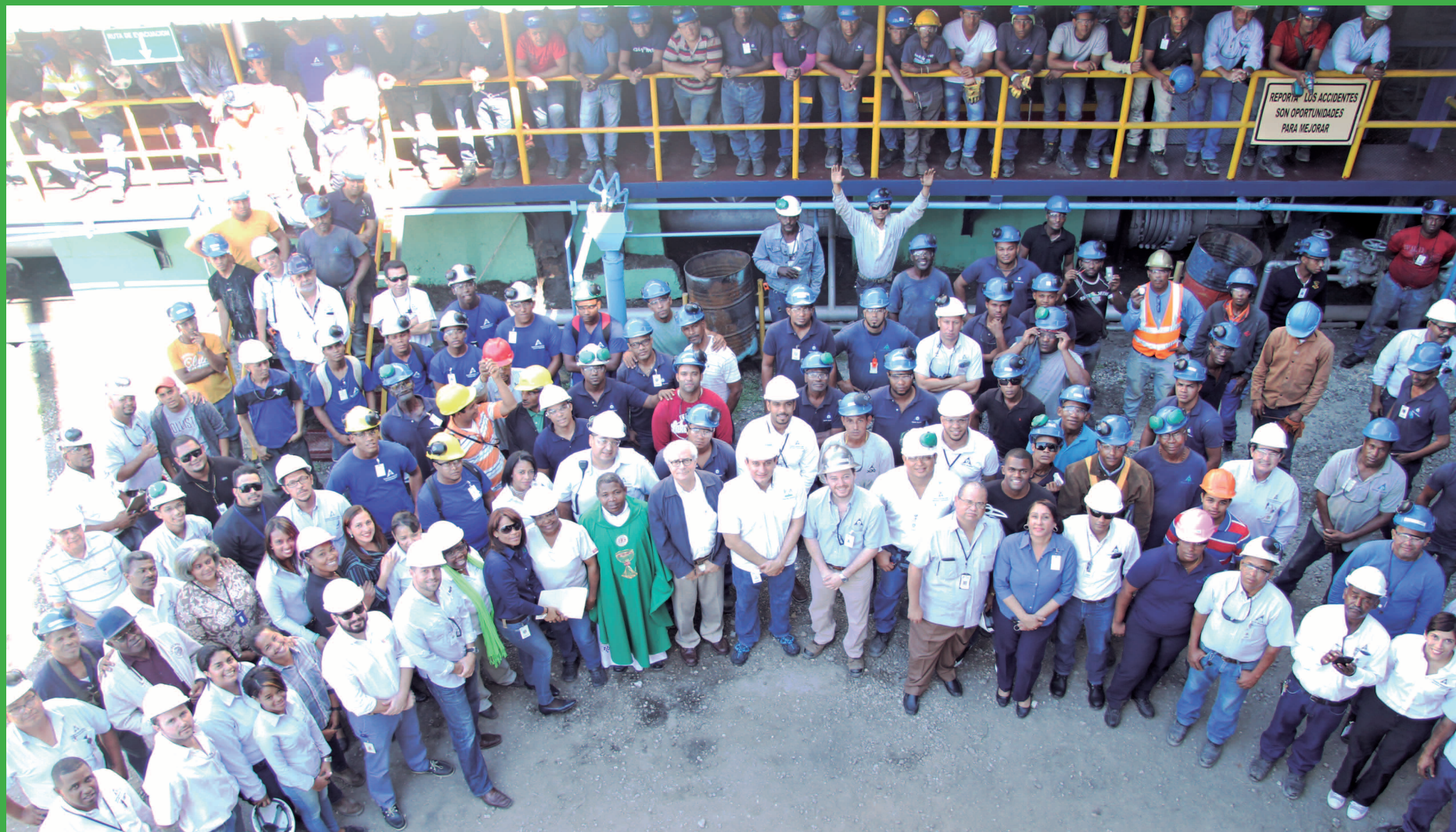
La gran familia CAC une todos sus talentos para esta nueva zafra.

Daños ocasionados por ganado a siembra de caña supera los RD$18 millones