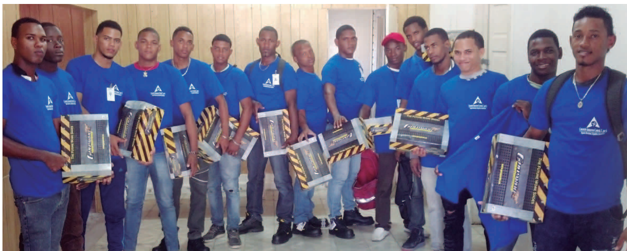
El grupo de jóvenes reciben sus Equipos de Protección Personal.