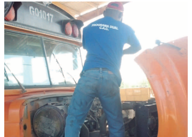
Uno de los jóvenes en plena faena realizando prácticas en un vehículo diesel.