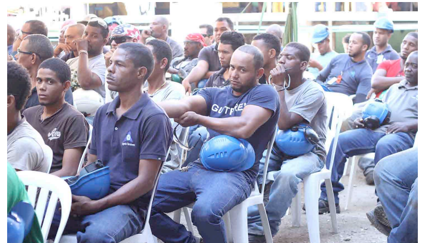
Empleados de las diferentes áreas del CAC participaron en la misa de inicio de zafra.