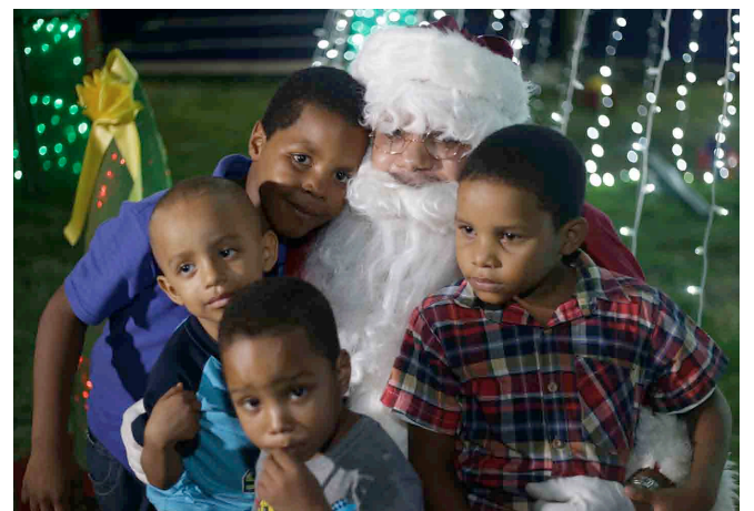
Los niños con Santa Claus se divierten y gozan durante la velada.

Durante la velada se realizaron rifas, así como un conjunto típico amenizó con cantos alegóricos a la época.