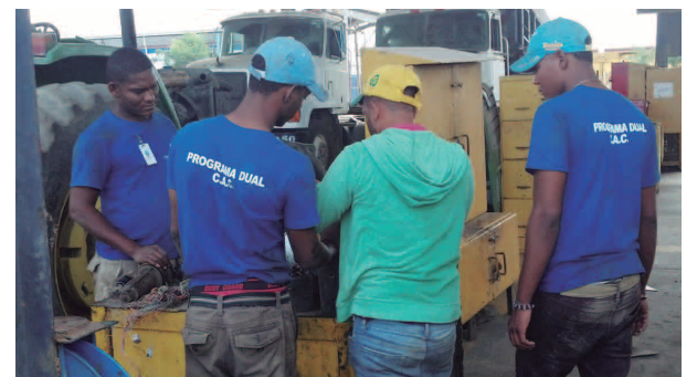
15 jóvenes están en el Programa Dual Mecánica Diesel y reciben acompañamiento de los técnicos del CAC.