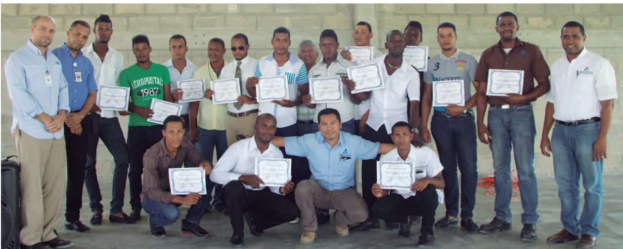
El grupo de graduandos junto a los directivos del CAC, en el acto de graduación del Programa Dual de Mecánica Diesel del CAC en alianza con el INFOTEP.

Hidalgo anunció que el CAC e INFOTEP iniciará tres programas dual más. “Creo que esta empresa tiene un alto empoderamiento con el tema de responsabilidad social empresarial para llevar a cabo estos programas”, expresó el funcionario del INFOTEP.