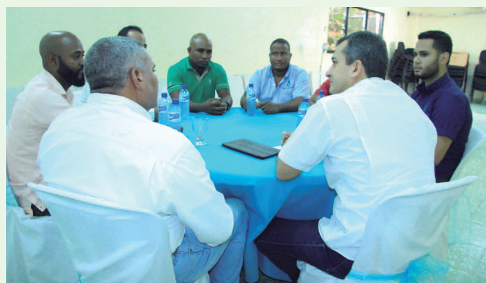
Desayuno correspondiente al mes de septiembre.