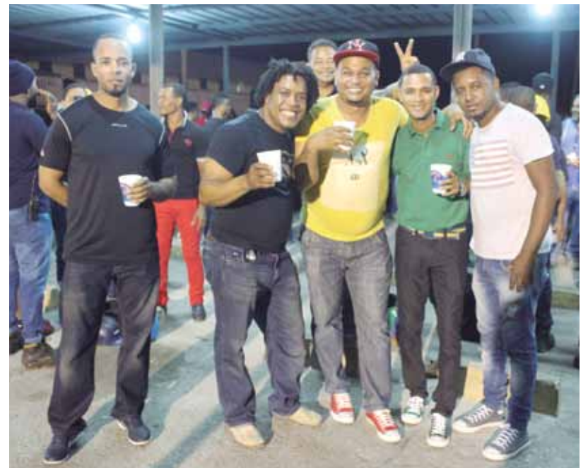
Los trabajadores de fábrica comparten con alegría este momento de cierre de la zafra 2014-2015.