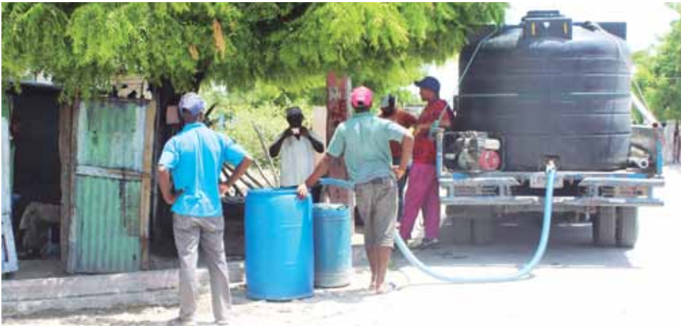
En el Barrio Los Block de Villa Central se está distribuyendo agua potable con los fondos que ha dispuesto el CAC.