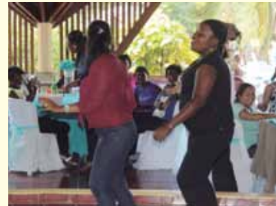
El baile no podía faltar.