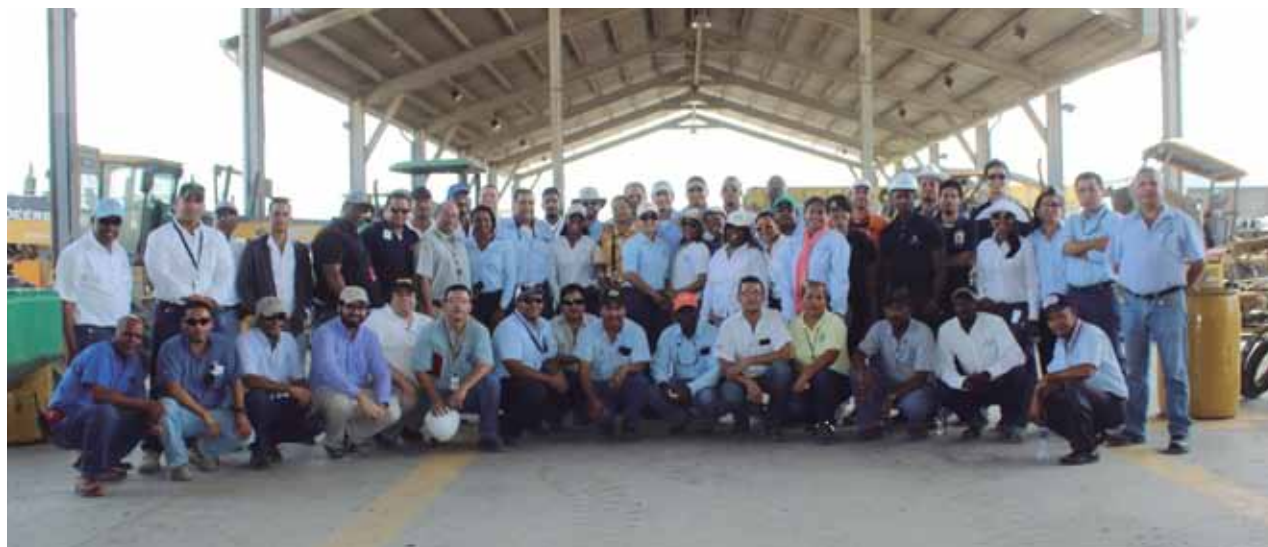
El grupo de empleados del CAC en el taller.