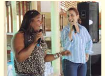
El canto, uno de los tantos talentos de las madres del CAC.