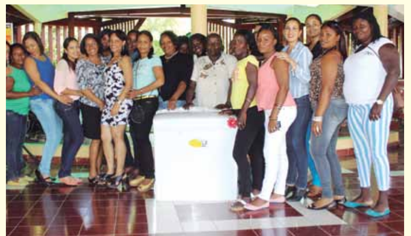
Madres se unen y comparten la entrega del gran premio.

La actividad que inició con un almuerzo, transcurrió entre cantos, bailes y rifas de obsequios, tales como abanicos de pedestal, secadores de pelo, DVD, microondas, dinero en efectivo y el gran premio, una lavadora.