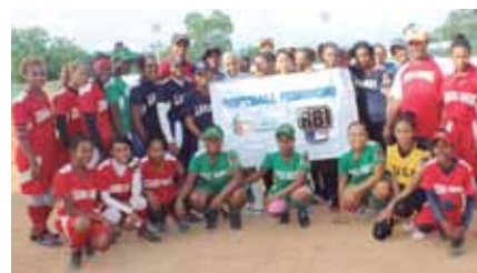
Las integrantes de los equipos de softbol femenino del RBI Barahona.