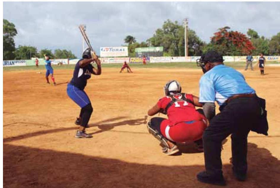
Los equipos femeninos del RBI Barahona, en plena acción del partido.