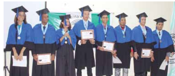
8 jóvenes se graduaron de bachilleres convirtiéndose en la primera promoción del Colegio Jesús en Ti Confío.