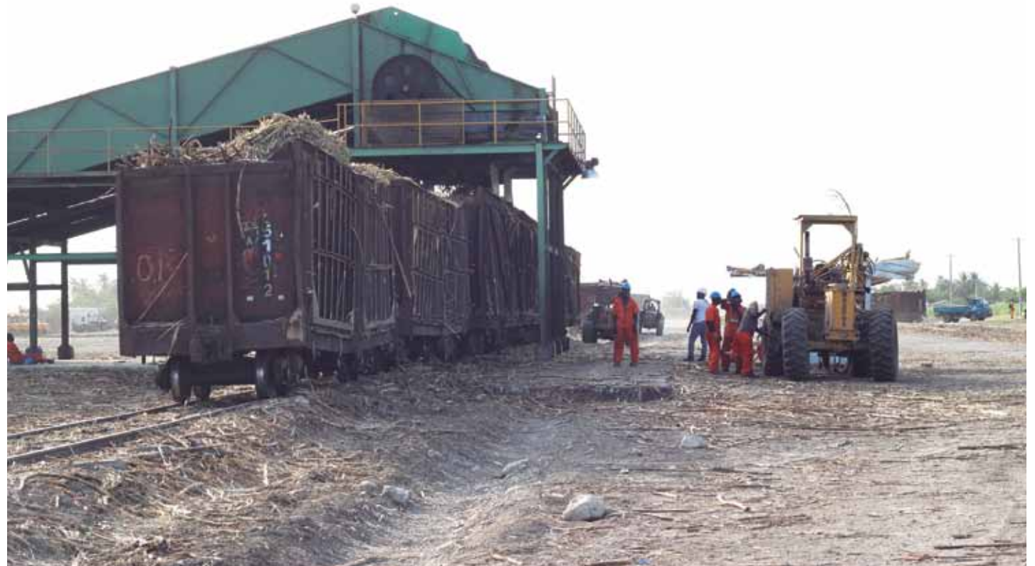
La molienda de caña se ubicó en 631 mil 568 toneladas.