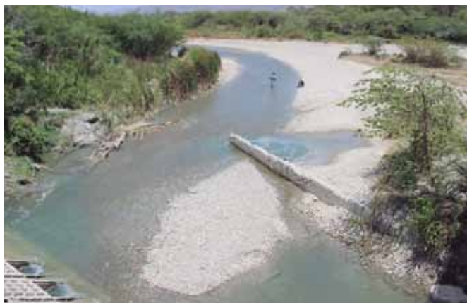
Los comunicadores también pudieron observar el bajo flujo de agua en el Dique de Santana y recibieron explicaciones de como se distribuye el agua tanto para Vicente Noble, Tamayo y la zona cañera.