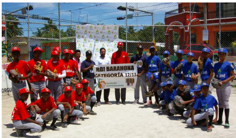
Equipos de las categorías 12-13 años, posan junto a sus entrenadores.