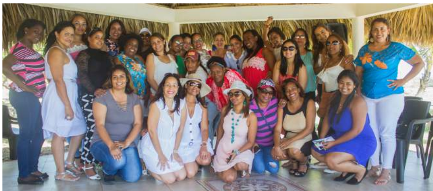
Equipo de mujeres del área Agrícola.

El primero fue realizado para las mujeres del área Agrícola, quienes pasaron una tarde entre música, canto, bailes y premios; tuvo lugar en la Piscina Oasis del Caribe, en la comunidad el Granado de Tamayo. Mientras que el segundo, correspondió a las mujeres Administrativas, quienes pasaron una agradable mañana entre risas, canciones, sorpresas y muchos más.