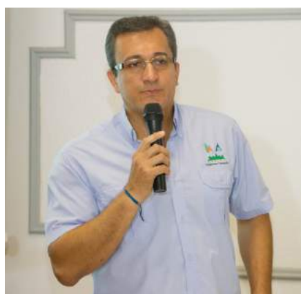
Gerente General del CAC mientras pronuncia palabras centrales del evento.