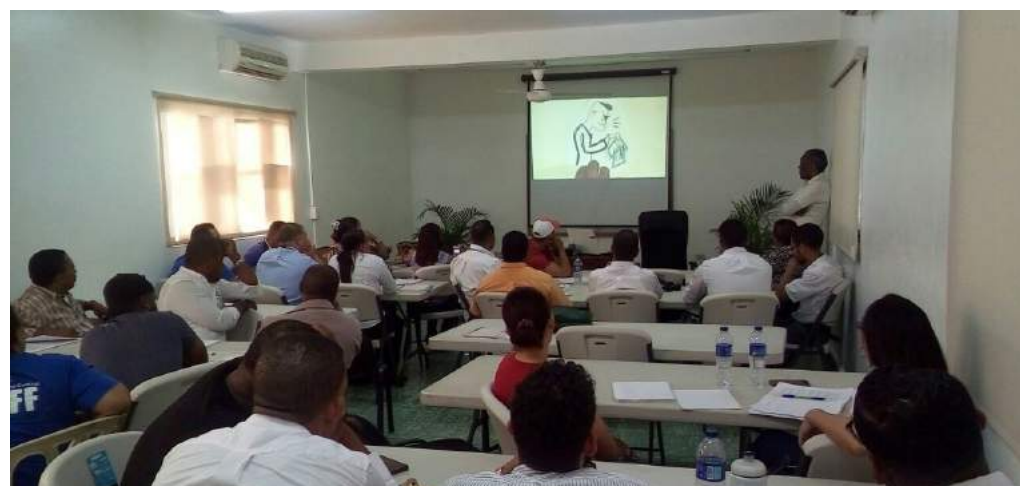
Diplomado Habilidades de supervisión.