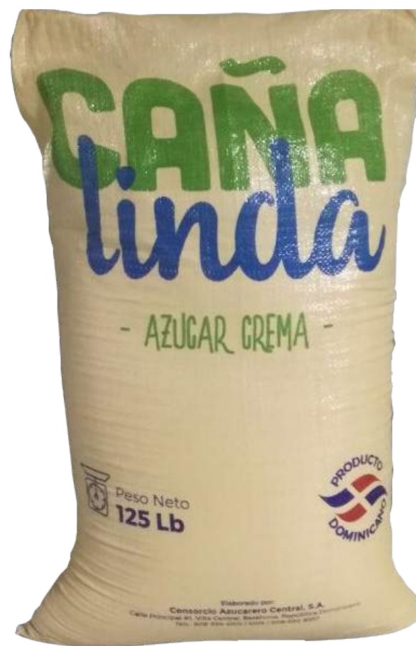
Presentación a granel en sacos de 125 libras.

*El producto estará también disponible en supermercados y cadenas pequeñas.