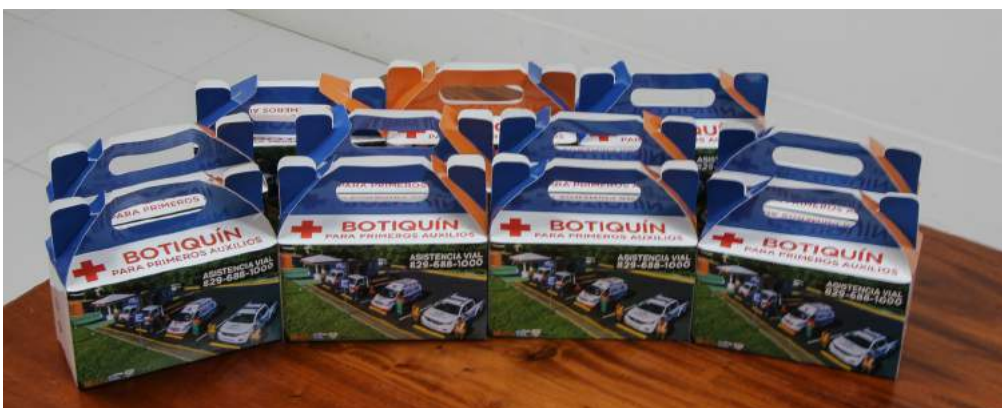
Botiquines de primeros auxilios se han distribuido en distintas oficinas para imprevistos de salud.