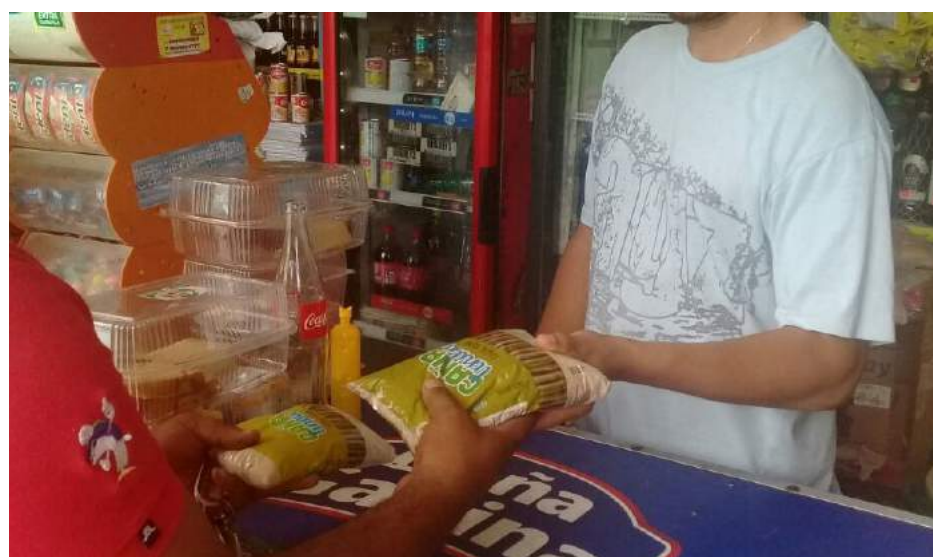
Producto disponible ya en colmados.