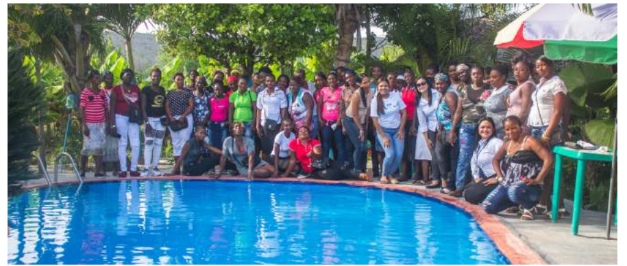
Equipo de mujeres de las áreas Administrativas.