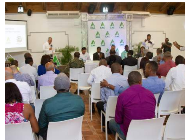
Parte del público asistente al lanzamiento del Programa.