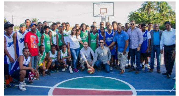
Jóvenes participantes del torneo junto a directivos del CAC e invitados especiales.