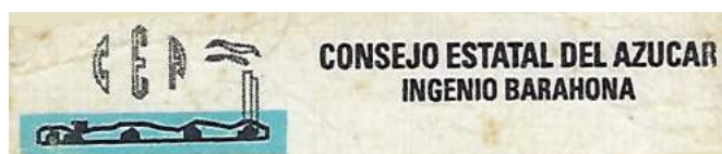
Logo CEA - Ingenio de Barahona (hasta 1999).