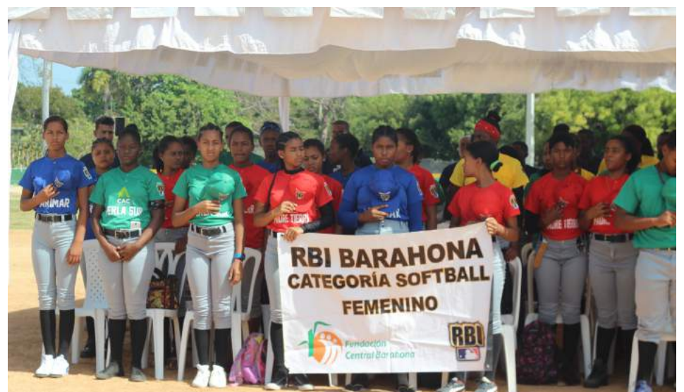
Equipo femenino de Softball.