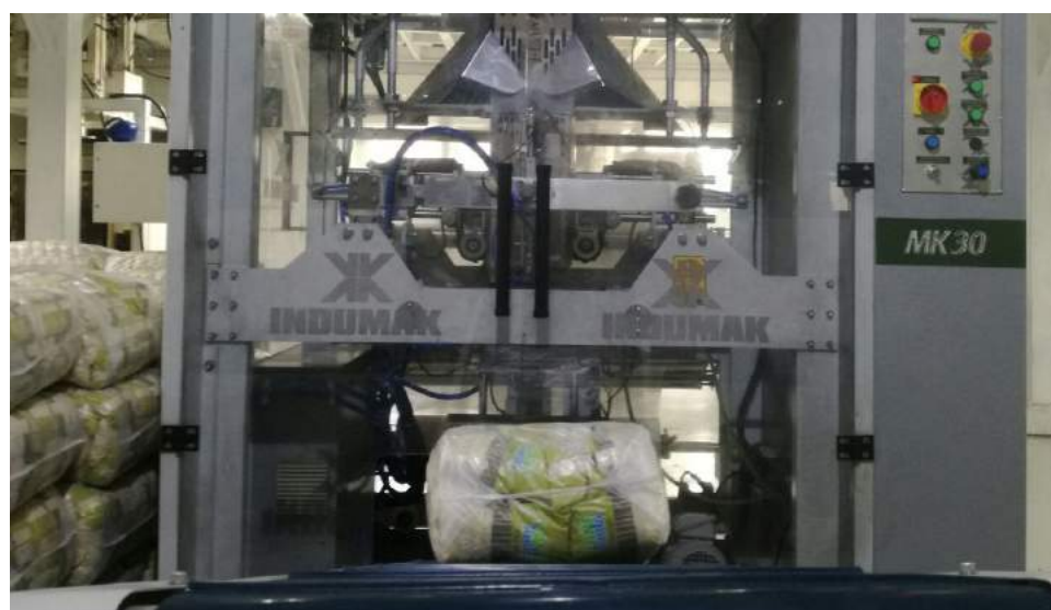
Proceso de enfundado.

Oficina: 809-560-4516 | Ventas: 829-560-7589, 809-983-1626