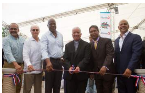
Invitados especiales hacen el corte de la cinta.