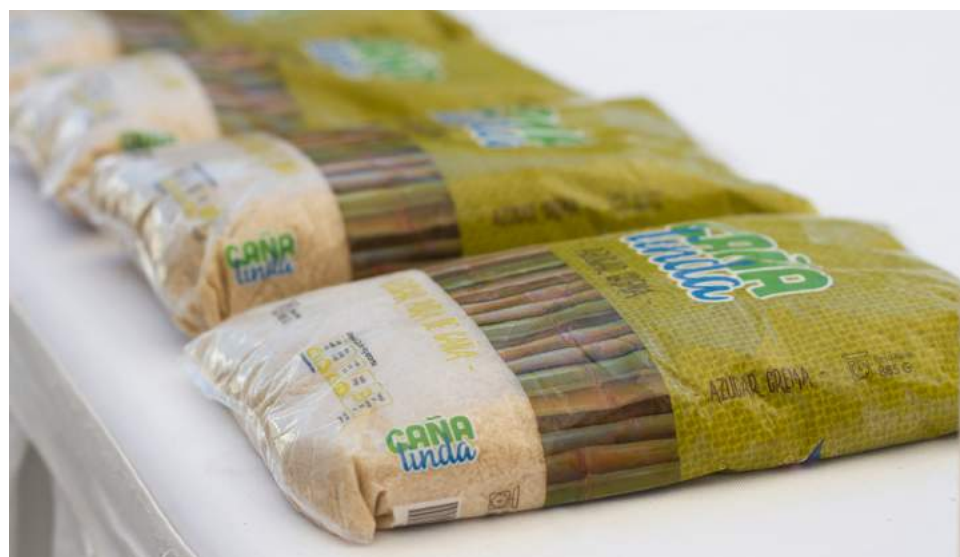
Presentaciones al detalle de 2 libras.