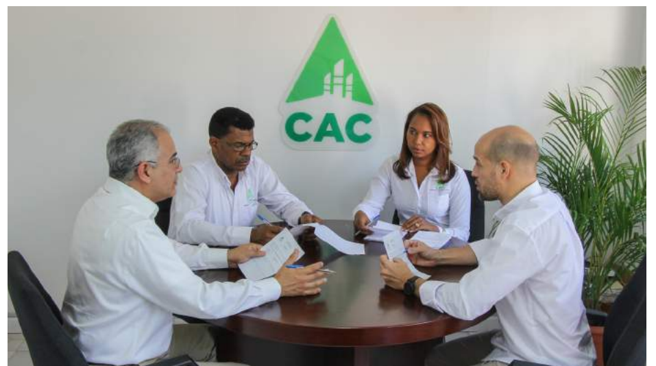
Comité verificando la lectura de las cartas recibidas.