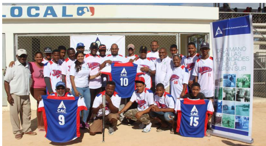
Equipo de Jaquimeyes reciben contribución para el desarrollo del deporte de la comunidad.

Como parte de su programa de apoyo a la práctica de deportes, el Consorcio Azucarero Central (CAC) dotó de nuevos uniformes al equipo de Softball de Jaquimeyes, para su identificación en los diferentes torneos en los que participa.