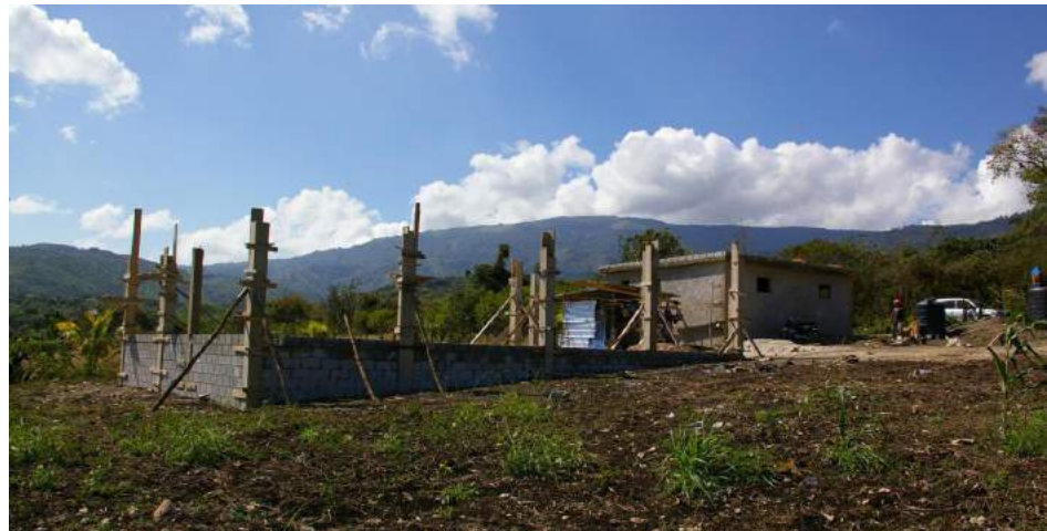
Estado de construcción de los establos para cabras.

En esta primera etapa el personal técnico entre los que se encontraban